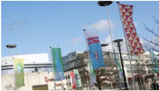
Rechts het Klarendalse banier tussen de 22 andere banieren, eind november op het Velperplein.

Carnavalsvereniging de On-Ganse organiseert al drie jaar een Arnhems Vrijwilligersgala (AVG) in het Musis Sacrum. Elk jaar richt dit feest zich op vrijwilligers vanuit een bepaalde hoek. Het derde AVG op zaterdag 14 november 2009 werd aangeboden aan vrijwilligers die actief zijn in de Arnhemse wijken. Naast het feit dat het feest druk bezocht werd, is er binnen dit thema nagedacht over betrokkenheid van de wijken en samenhang met de stad. Zo ontstond het idee om alle wijken een vaandel, als symbool van eigenheid, aan te bieden. De banieren zouden qua gevoel moeten aansluiten bij de wijken en haar bewoners.