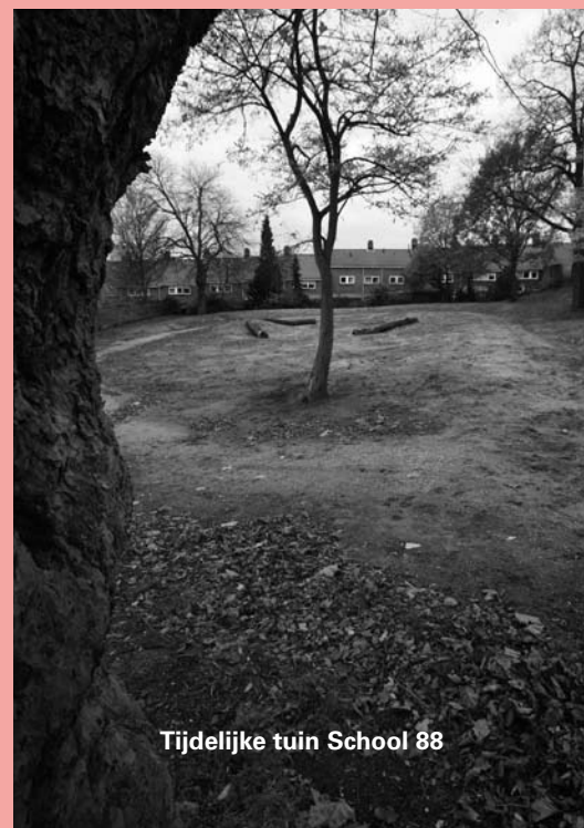
Tijdelijke tuin School 88

Met de binnentuin gaat een wens van omwonenden in vervulling, weet hij. "Uit een enquête bleek dat omwonenden daar een parkje wilden. Maar het bestemmingsplan laat dat niet toe. Er is echter geld beschikbaar gekomen van 'reizende tuinen'." Dat zijn tijdelijke tuinen die worden aangelegd op braakliggende terreintjes waarop later gebouwd gaat worden. Het 'parkje' achter School 88 is dus tijdelijk. Roodbergen: "Maar het is niet waarschijnlijk dat op die plek snel gebouwd zal worden."