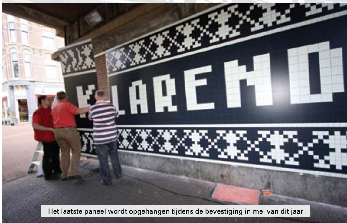
Het laatste paneel wordt opgehangen tijdens de bevestiging in mei van dit jaar