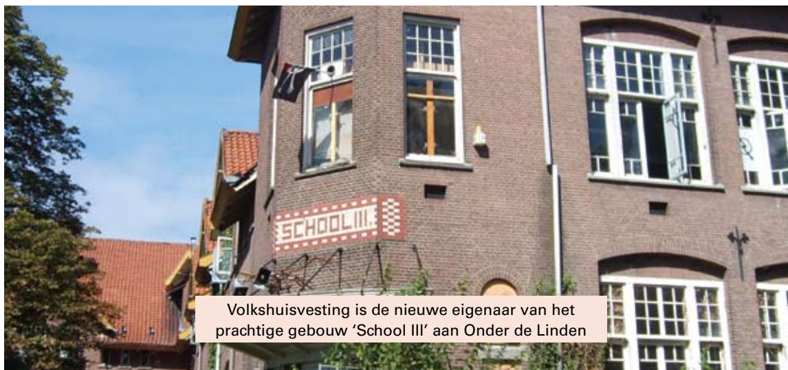
Volkshuisvesting is de nieuwe eigenaar van het prachtige gebouw 'School III' aan Onder de Linden