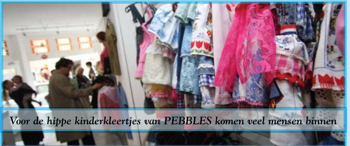
Voor de hippe kinderkleertjes van PEBBLES komen veel mensen binnen