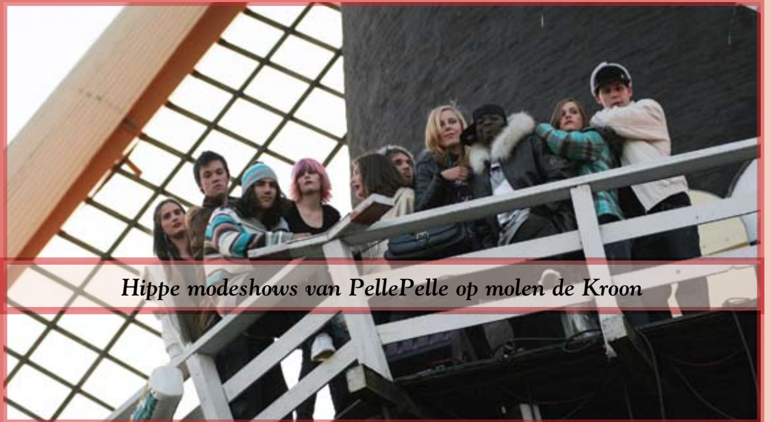
Hippe modeshows van PellePelle op molen de Kroon