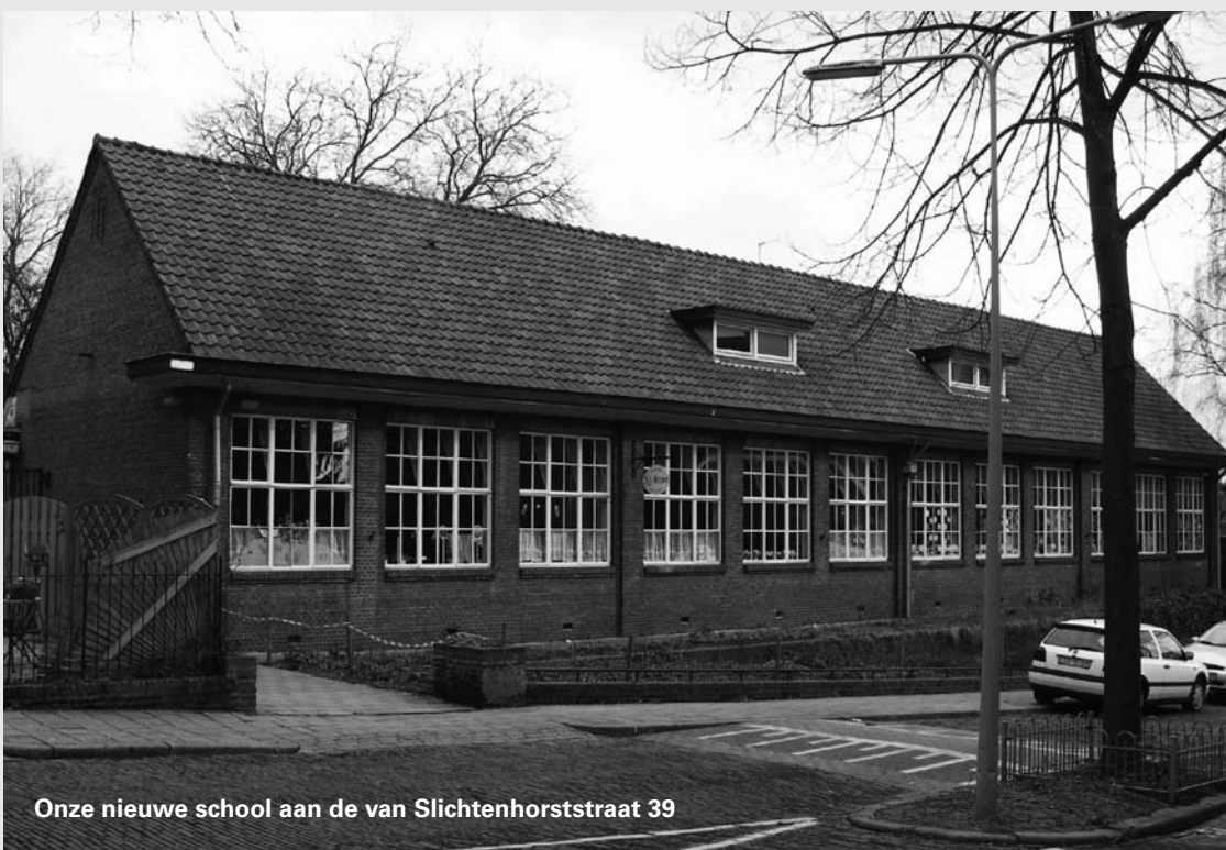
Onze nieuwe school aan de van Slichtenhorststraat 39