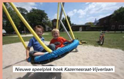
Nieuwe speelplek hoek Kazernesraat-Vijverlaan

Tijdens de BGB-werkzaamheden is gebleken dat hier en daar punten nooit zijn meegenomen of waaraan nooit is gedacht. Ook bewoners hebben de gemeente hierop gewezen. Het gaat bijvoorbeeld om bestrating en tegels in tussenpadjes en doorsteekjes, en boomspiegels. De gemeente inventariseert momenteel waar zulke werkzaamheden nog nodig zijn.