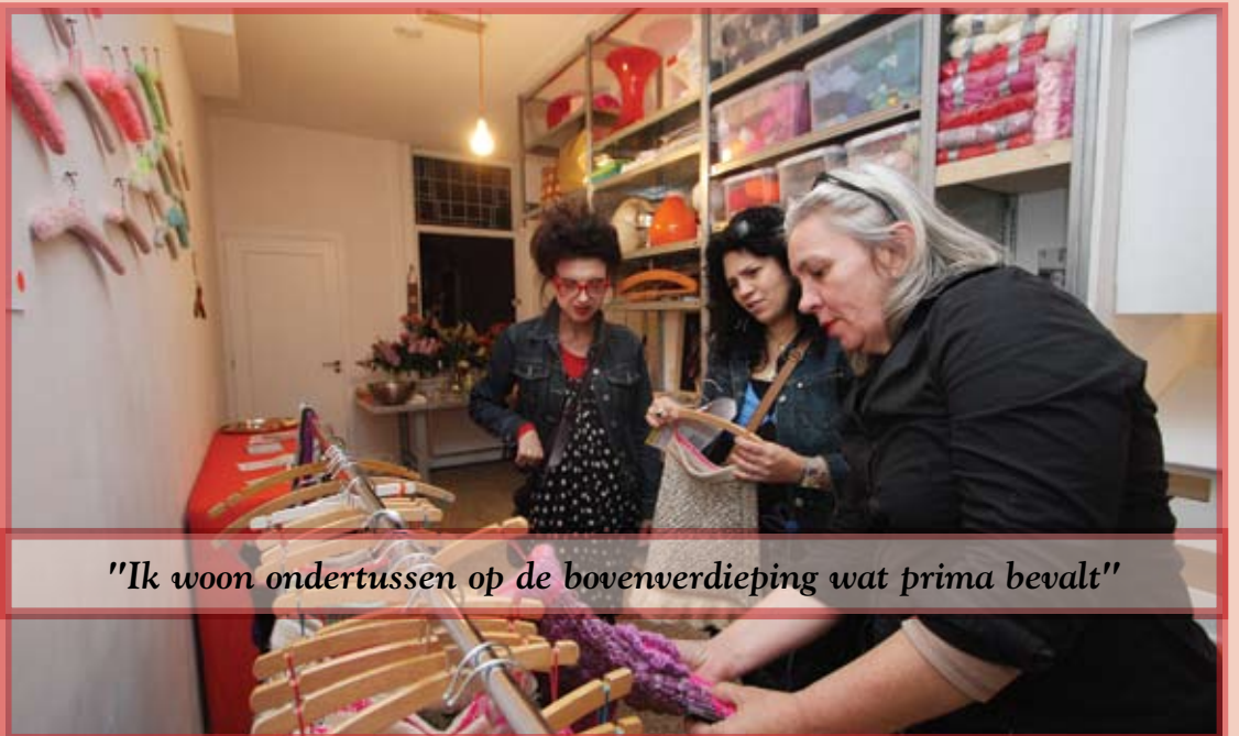
"Ik woon ondertussen op de bovenverdieping wat prima bevalt"