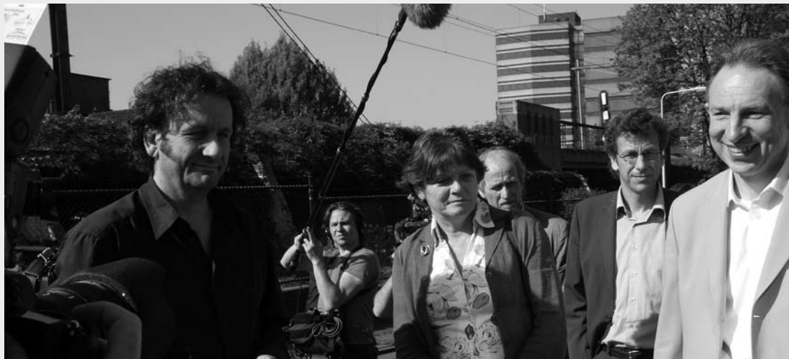
Minister Ella Vogelaar tijdens haar Wijkentour in Klarendal - april 2007 - langs het Modekwartier