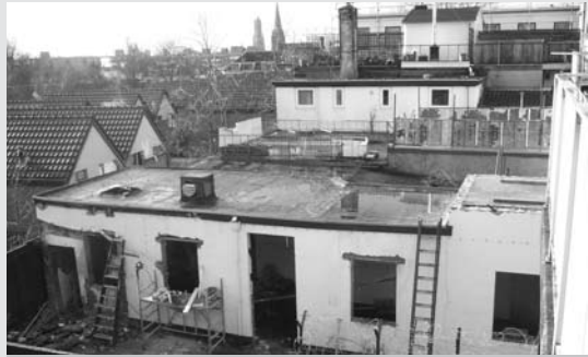
Van het gebouw van bakker Sanders blijven bijna alleen de muren staan.

Onrust aan de Klarendalseweg! Een tijd geleden is de sloop in de voormalig Bakkerij Sanders begonnen. Dit was voor de wijkkrant aanleiding eens te polsen hoe het bij de Volkshuisvesting staat rondom de realisatie van het Modekwartier.