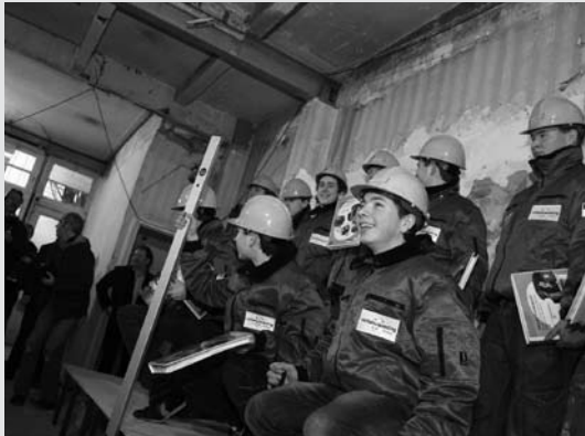
Bouwvakertjes in opleiding op de catwalk met alle nodige media aandacht.

Nog verder hogerop de Klarendalseweg – nummer 181 t/m 183 – is een stageproject van start gegaan. Deze door Volkshuisvesting aangekochte panden worden opgeknapt door leerlingen van het Aretheem college (afdeling techniek) onder begeleiding van Kuiper Bouwgroep. Dit project heet LEVENSECHTLEREN en ook daar is het de bedoeling dat er zich modeondernemers zullen gaan vestigen. Op 31 januari was de kick-off met een heuse bouwvakkers catwalk.