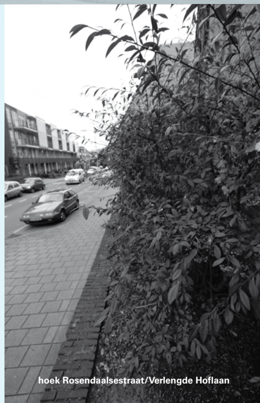
hoek Rosendaalsestraat/Verlengde Hoflaan

Bij Onder de Linden - Klarendals groene trots - leidde dit al resultaten. De gemeente nam ideeën over voor de hondenuitlaatplaats. Er komen nieuwe bomen en struiken bij (onder andere hulst, rododendrons, krentenboom, magnolia-boom). Ook zullen 'rommelplekjes' verdwijnen. Bij de Leuke Linden komen planten op het dijkje bij de zandspeelplaats en bloeiende bomen met grote bladeren (catalpa). "Hier kunnen ouders onder gaan zitten, lekker in de schaduw." Langs de rand en bij de ingang komen vlinder- en rozenstruiken. "Mooi voor de Leuke Linden en mooi voor het straatbeeld."