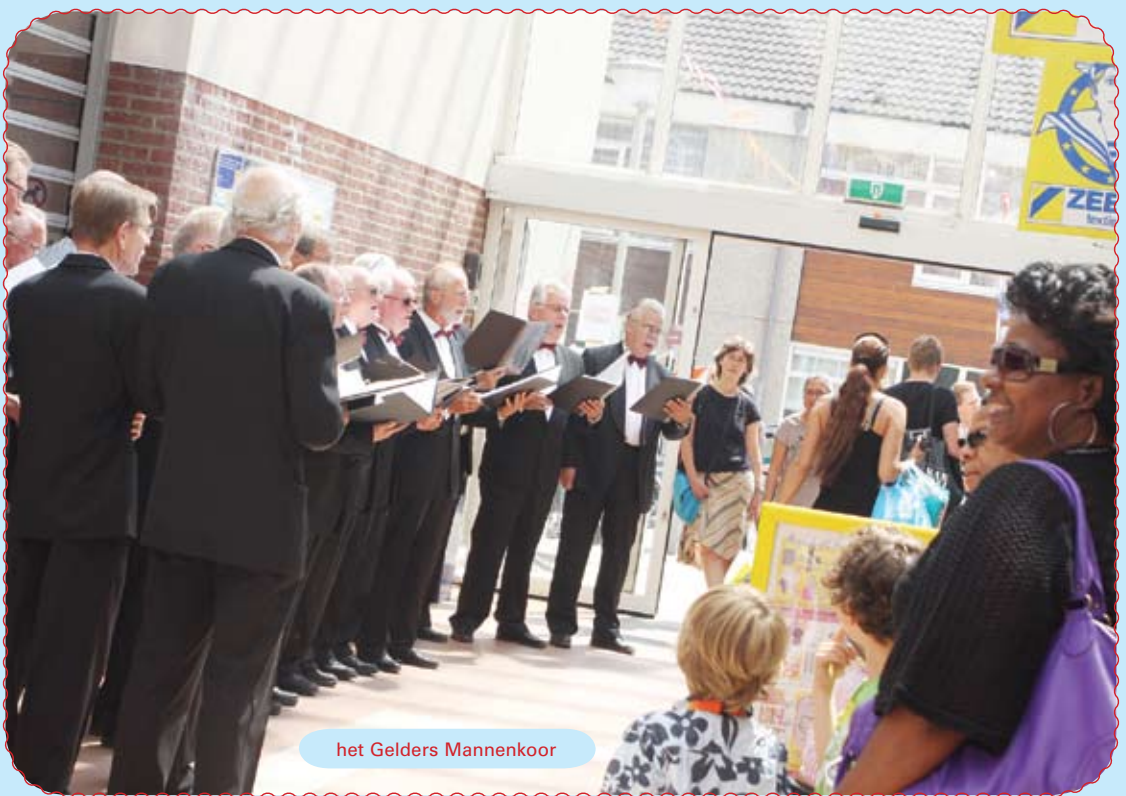
het Gelders Mannenkoor