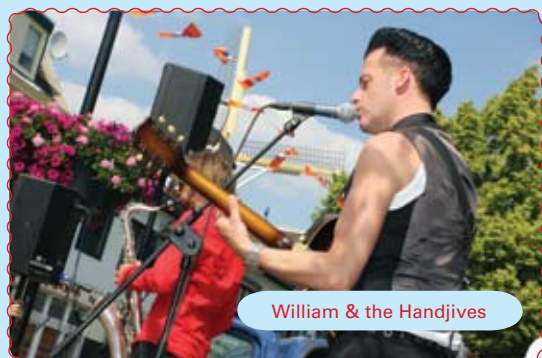
William & the Handjives