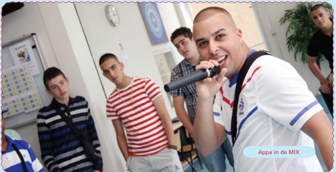
Appa in de MIX