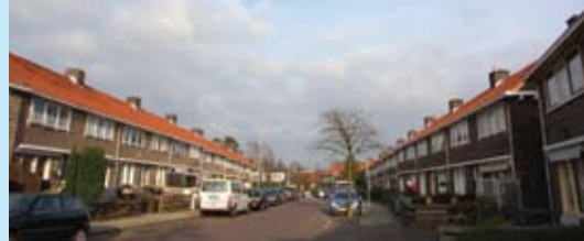
St. Janskerkstraat geen nieuwe riolering