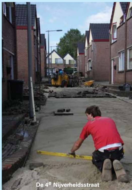
De 4 e Nijverheidsstraat

De 1 e , 2 e en 4 e Nijverheidsstraat worden grootschalig aangepakt. In elke straat wordt het asfalt vervangen door klinkers. In de 1 e Nijverheidsstraat komt tegenover de huizen een grasveldje. Ook krijgt de speeltuin een grote opknapbeurt, inclusief nieuwe speeltoestellen. Onder de speeltoestellen komt 'valzand', volgens de wet is een veilige ondergrond noodzakelijk.