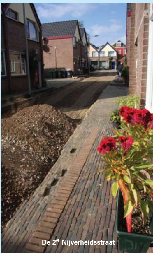
De 2 e Nijverheidsstraat

De 3 e Nijverheidsstraat is nu nog op basisniveau. "Het enige wat we hier doen is wat klein onderhoud", zegt Kosters. "Dat betekent dat stenen en tegels worden recht gelegd, zodat er geen oneffenheden meer zijn. Dat voorkomt struikelen en het ontstaan van plassen bij regen."