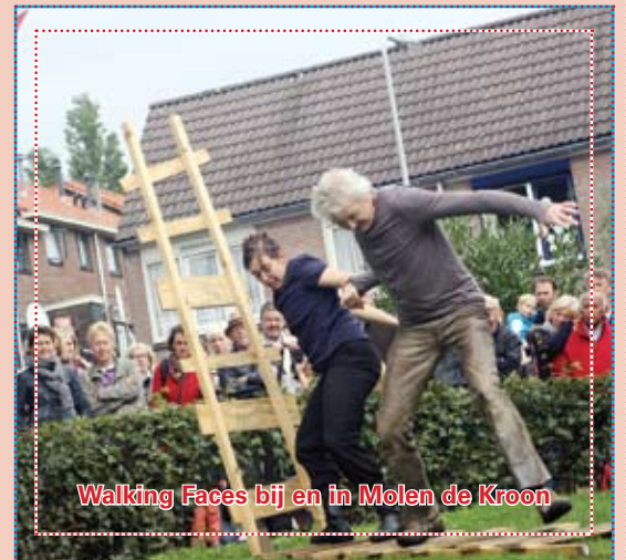
Walking Faces bij en in Molen de Kroon