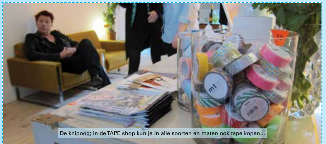
De knipoog; in de TAPE shop kun je in alle soorten en maten ook tape kopen...

Het assortiment is aangevuld met lampen en vazen. Je kunt er dan ook weer koffie drinken, ouderwetse filterkoffie in een modern jasje.