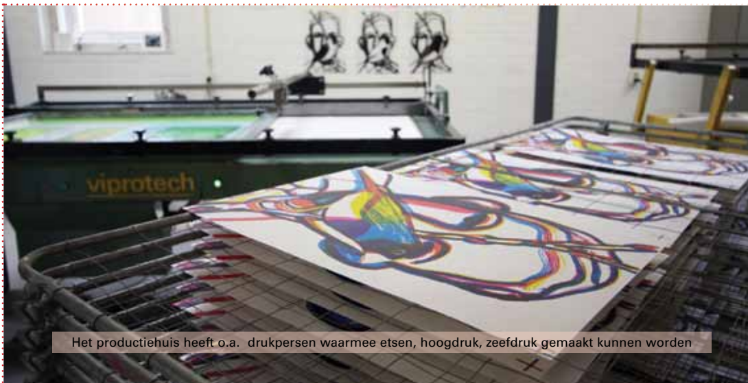
Het productiehuis heeft o.a. drukpersen waarmee etsen, hoogdruk, zeefdruk gemaakt kunnen worden

Klarendal is weer een culturele hotspot rijker.