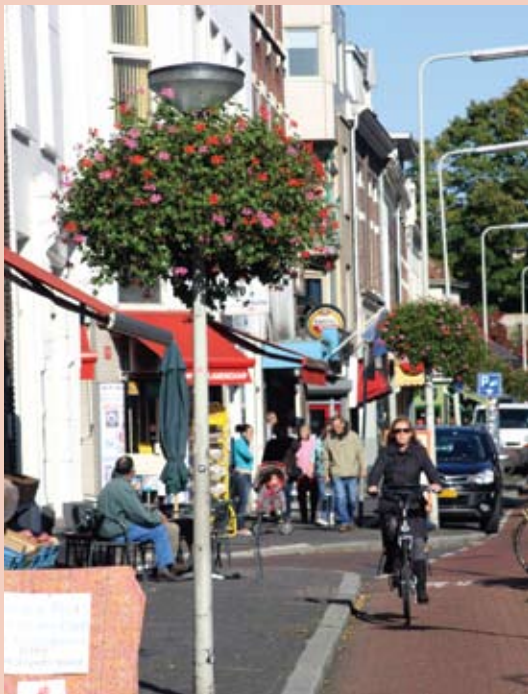
Hangingbaskets aan de Hommelstraat vorig seizoen.

Het is een feestelijk begin van de Klarendalse weg in haar nieuwe staat, waar bewoners en ondernemers uit Klarendal van kunnen genieten. Groengroep Klarendal en de Bewonersgroep hebben dit financieel mogelijk gemaakt. Aan de ondernemers en Volkshuisvesting is sponsoring gevraagd, met het oog op mogelijke voortzetting in de komende jaren.