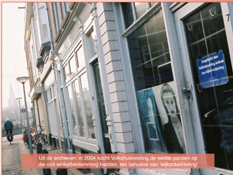
Uit de archieven: in 2004 kocht Volkshuisvesting de eerste panden op die ooit winkelbestemming hadden, ten behoeve van 'wijkontwikkeling'