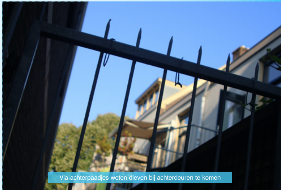
Via achterpaadjes weten dieven bij achterdeuren te komen

Er zijn inmiddels diverse arrestaties verricht naar aanleiding van meldingen en er wordt dan ook op aangedrongen dat vooral te blijven doen. Als slachtoffer herinnert men zich vlak na het incident onbewust details die de politie kunnen helpen bij hun werk. Dus mocht je slachtoffer zijn van een insluiper, wacht dan niet te lang met melden. Hoewel het in de ogen van de burger niet altijd zo lijkt loont het namelijk wel degelijk de moeite.