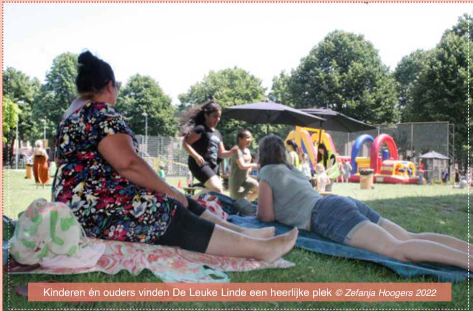
Kinderen én ouders vinden De Leuke Linde een heerlijke plek

Na jaren van voorbereidingen hebben we op woensdag 3 juli met trots de plannen voor een nieuwe inclusieve speeltuin mogen presenteren aan buurtbewoners en geïnteresseerden. Samen met Gemeente Arnhem, Nationaal Programma Arnhem-