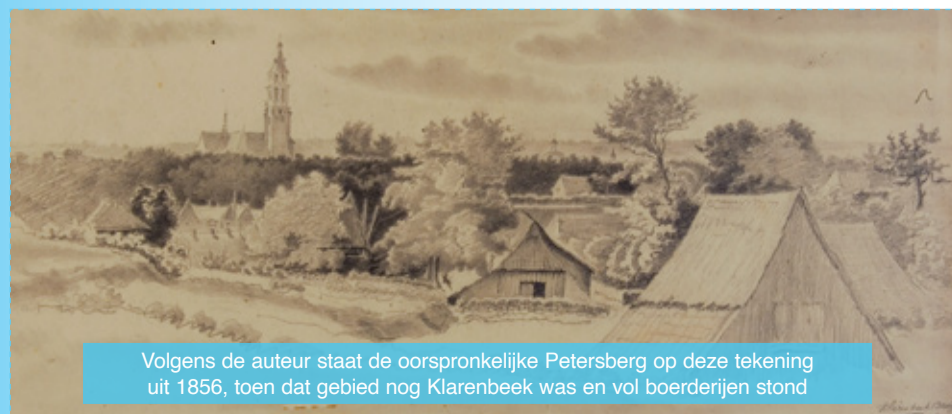
Volgens de auteur staat de oorspronkelijke Petersberg op deze tekening uit 1856, toen dat gebied nog Klarenbeek was en vol boerderijen stond

Het boek, inclusief acht kleurenpagina's, is te koop bij bekende boekhandels zoals Het Colofon in Arnhem. Het boek is ook te bestellen via de website: creawiki.nl/petersberg . De prijs van het boek is €25,-