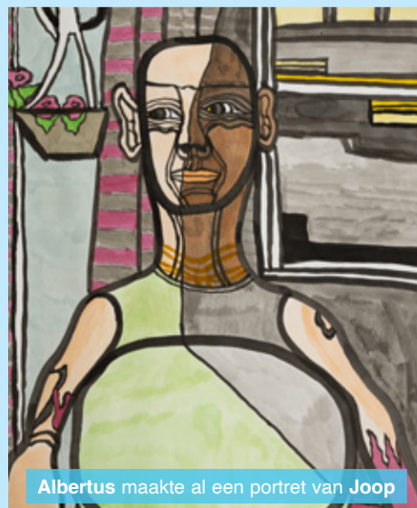
Albertus maakte al een portret van Joop

Stuur de foto voor 1 oktober naar: atelier23@siza.nl