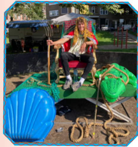
Enorm veel water tijdens het 51ste Speeldorp en zelfs Poseidon/Neptunus kwam langs!