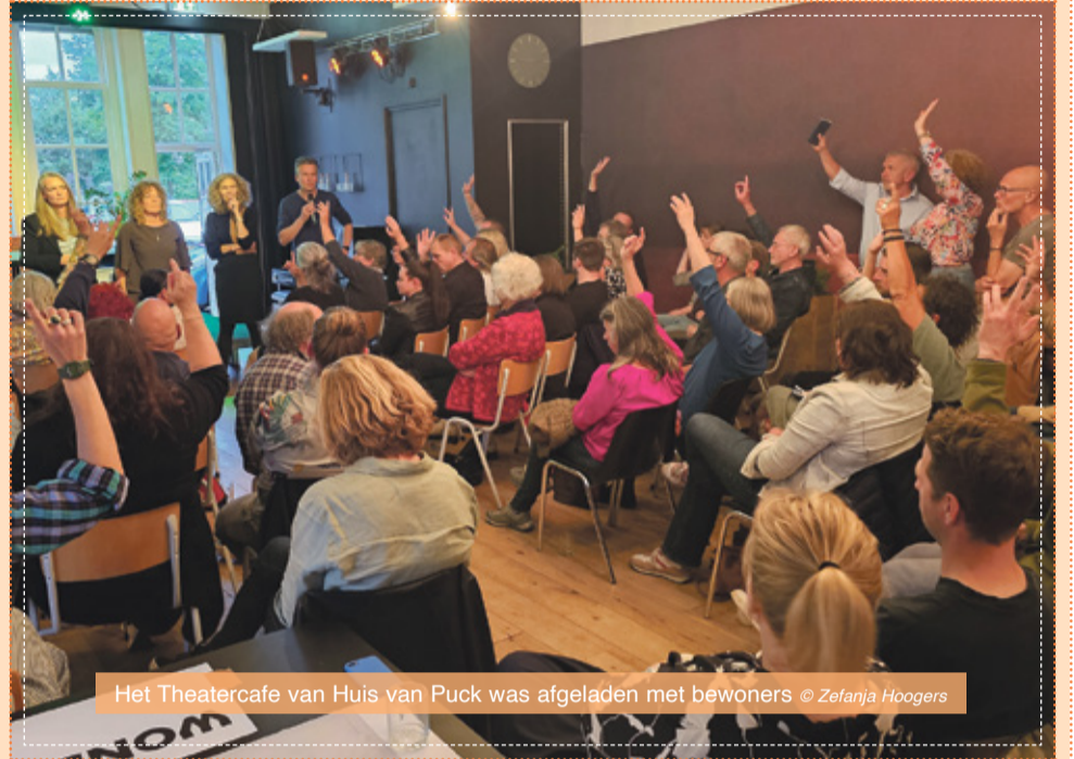
Het Theatercafé van Huis van Puck was afgeladen met bewoners

Tijdens het gesprek kwamen er drie opties voor de plek aan de Neerlandstuinstraat: (senioren)woningen, een parkje waar de