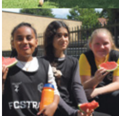
't Venster pag. 7