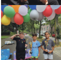
Speeldorp pag. 8