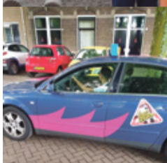
De slechtste chauffeur pag. 6