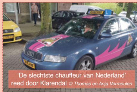
'De slechtste chauffeur van Nederland' reed door Klarendal

In een strak gestylede Lesauto werden we bloot gesteld aan de slechtste chauffeurs van Nederland. Wat een eer dat zoveel onvermogen ons ten deel is gevallen. Ik kan niet anders dan deze opnames van RTL voor Videoland zien als een politiek state-