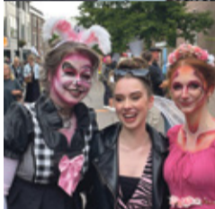
Nacht van de mode pag. 3