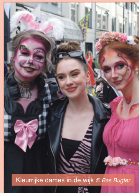
Kleurrijke dames in de wijk

Dat punt is nu gezet en dat hoort ook wel bij een wijk in ontwikkeling. Het is nu tijd om uit de stellingen te komen en met elkaar aan tafel te gaan om er weer een spetterend feest van te maken, waar