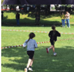
De Lighthart-school pag. 7