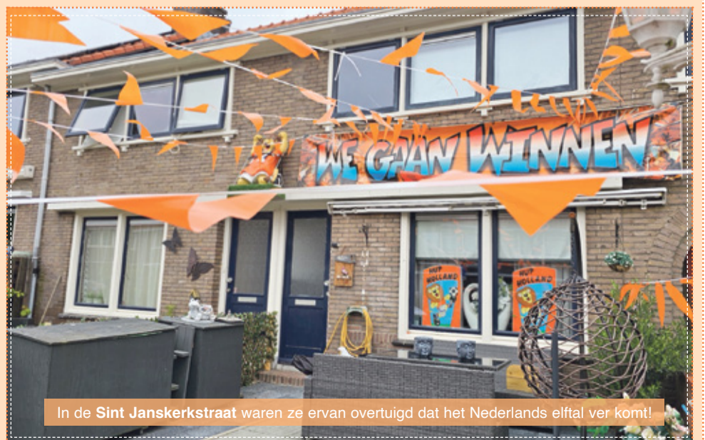
In de Sint Janskerkstraat waren ze ervan overtuigd dat het Nederlands elftal ver komt!