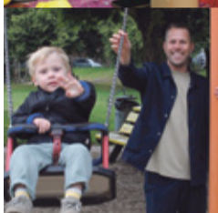
KlareTaal pag. 5