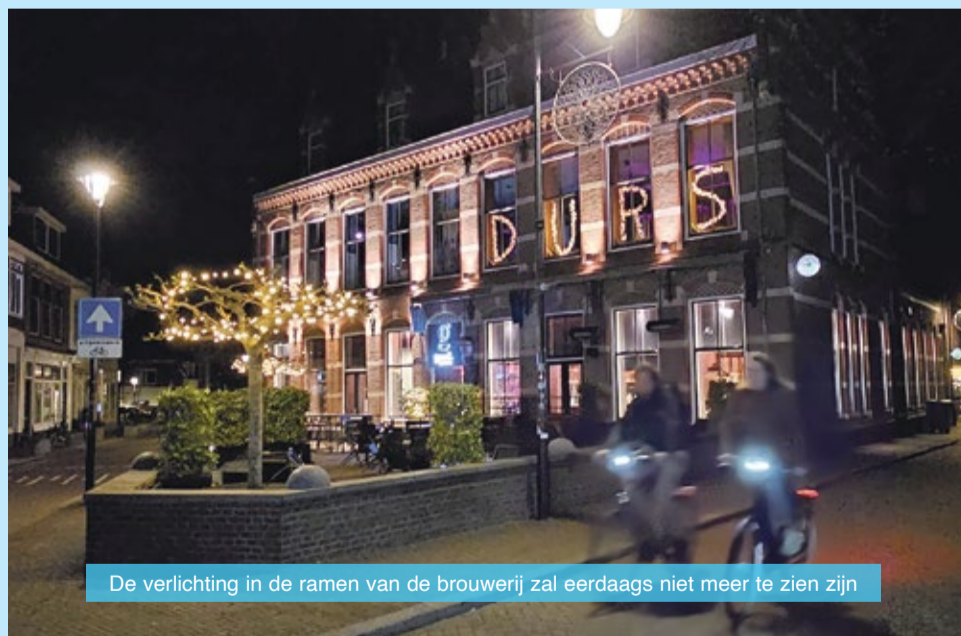
De verlichting in de ramen van de brouwerij zal eerdaags niet meer te zien zijn

Voor Klarendal heeft de brouwerij naast reuring rond het pand én een aantal verkooppunten van het eerste uur (bijvoorbeeld het Kaaskwartier en wijnkoperij Pangkara ), bij sommige typisch Arnhemse producten ook de wijk betrokken. Zo ontwikkelden ze een biertje met de naam 'Ernems Mokkel', waar vijf 'Ernems' topvrouwen de handen ineen hebben geslagen voor een blond seizoen