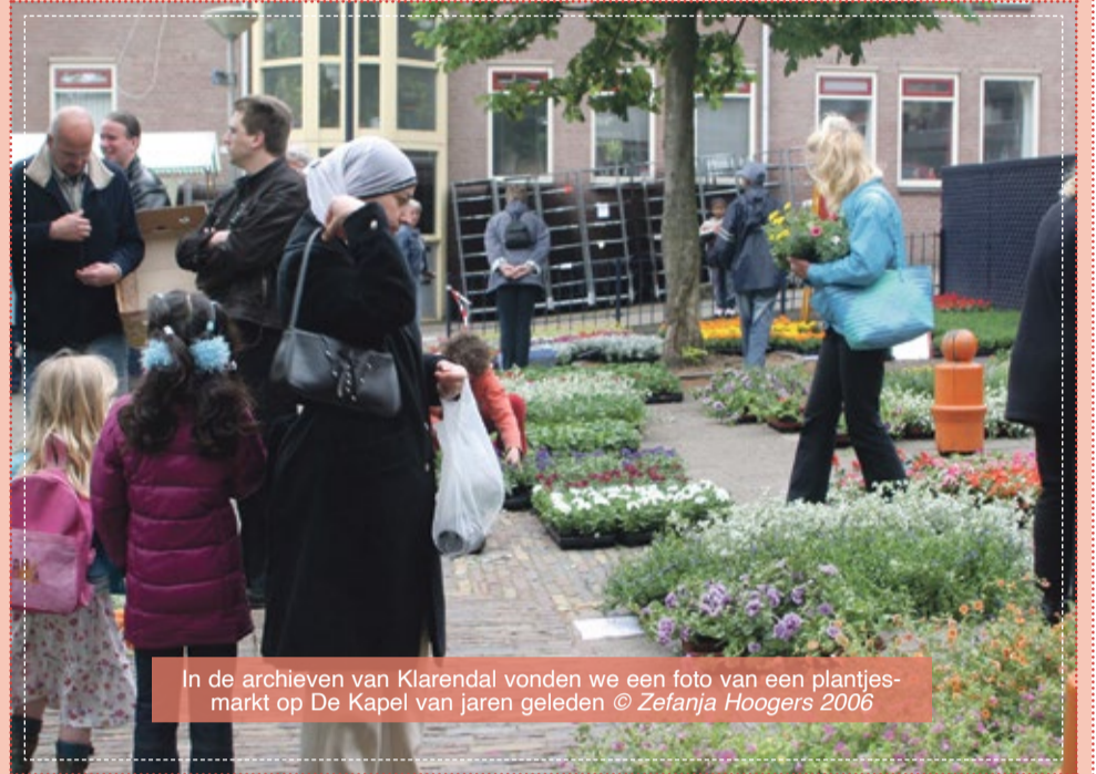
In de archieven van Klarendal vonden we een foto van een plantjesmarkt op De Kapel van jaren geleden

Trouwens: óók op het Graaf Otoplein in Sint Marten/Sonsbeek is die dag tussen 10.00uur en 14.00uur een plantjesmarkt!