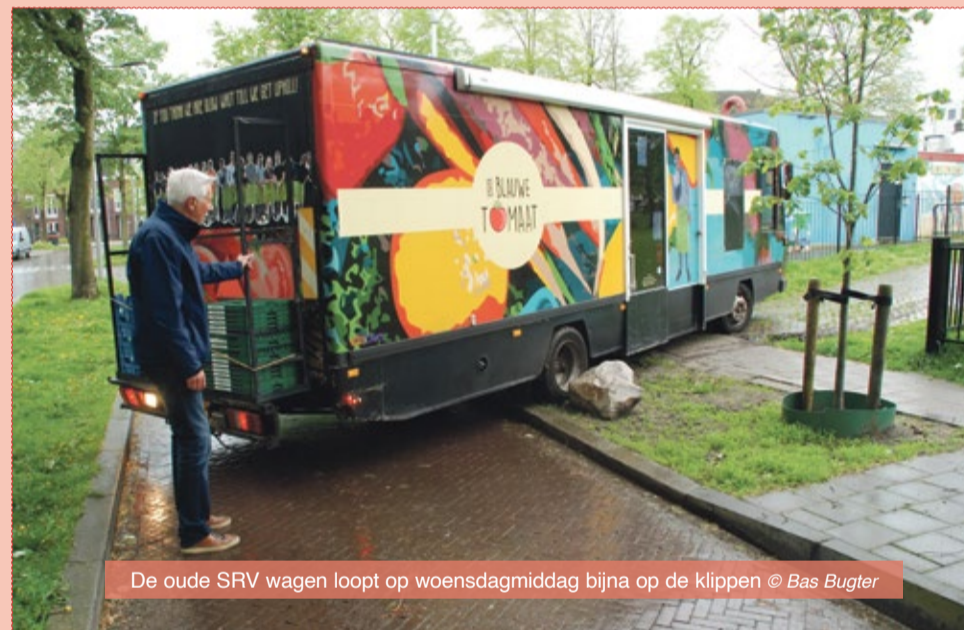
De oude SRV wagen loopt op woensdagmiddag bijna op de klippen

Behalve bij de nieuwe boom rechts van de ingang van De Leuke Linde. Daar heeft men de rots namelijk geplaatst voor het gedempte ouwe gat van de nieuwe boom. Dus niet voor de boom maar voor de ingang.