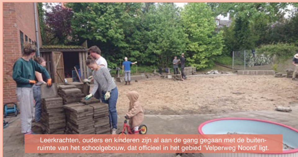
Leerkrachten, ouders en kinderen zijn al aan de gang gegaan met de buitenruimte van het schoolgebouw, dat officieel in het gebied 'Velperweg Noord' ligt.

Het ontwerp voor de buitenruimte is gebaseerd op ideeën van leerlingen, leerkrachten en ouders. Met de uitvoering ervan is een begin gemaakt, maar er is nog niet