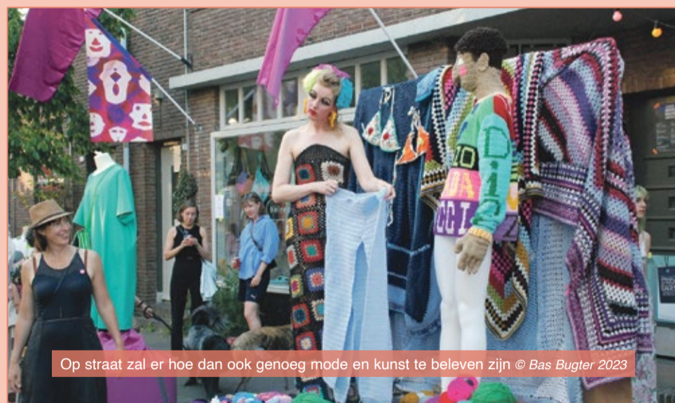
Op straat zal er hoe dan ook genoeg mode en kunst te beleven zijn

Oorspronkelijk is de Nacht van de Mode opgezet om de drempel naar de creatieve ondernemers te verlagen voor de bezoekers vanuit zowel Klarendal, Arnhem als daarbuiten. De afgelopen edities waren de locaties met versterkte muziek er wat veel geworden, waardoor bezoekers zich door