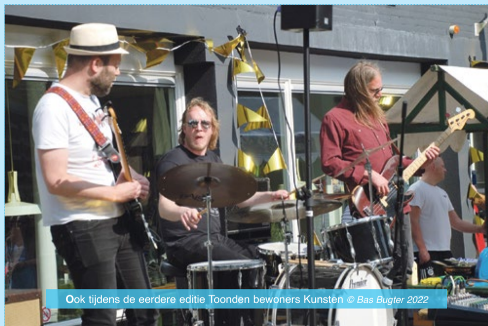
Ook tijdens de eerdere editie Toonden bewoners Kunsten

De talentenmarkt wordt georganiseerd door wijkbewoners in samenwerking met