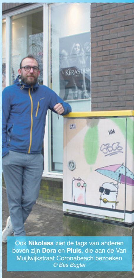
Ook Nikolaas ziet de tags van anderen boven zijn Dora en Pluis, die aan de Van Muijwijkstraat Coronabeach bezoeken

Voor een leuke themawandeling: de kastjes zijn te vinden in de Van Muijwijkstraat bij nr. 2 (modewinkels), nr. 64 (Corona Beach), nr. 68 (galeries), nr. 250 (horeca), Hommelstraat 44 (Libertas en Konijnenvoer), Hommelseweg 99 (sneaky figures), Nijhoffstraat 35 (barber- en tattooshops) en Willemstraat 18 (molen De Kroon).