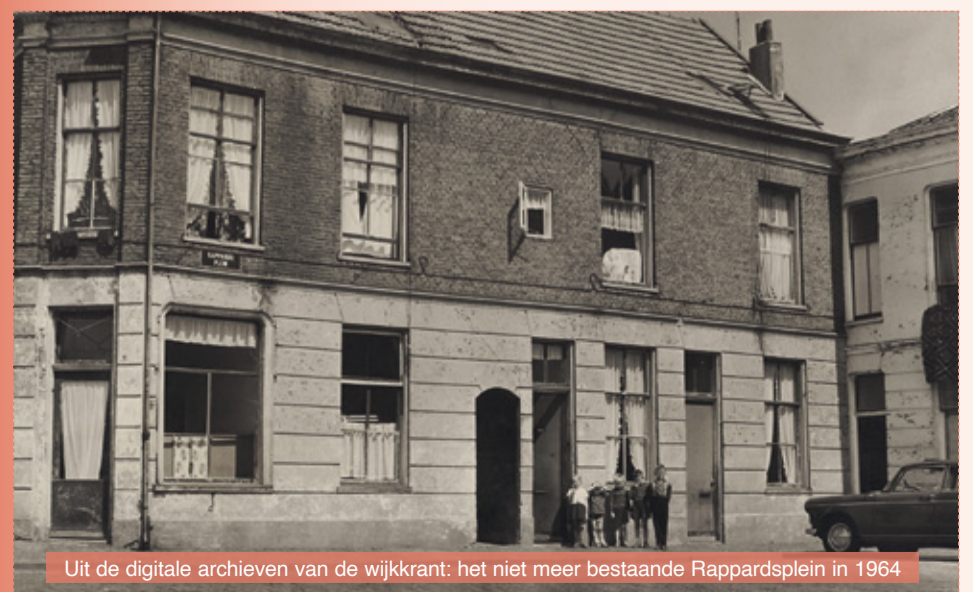
Uit de digitale archieven van de wijkkrant: het niet meer bestaande Rappardsplein in 1964

Kom langs! Klarendalseweg 439, maandag t/m vrijdag open tussen 10u en 16u.