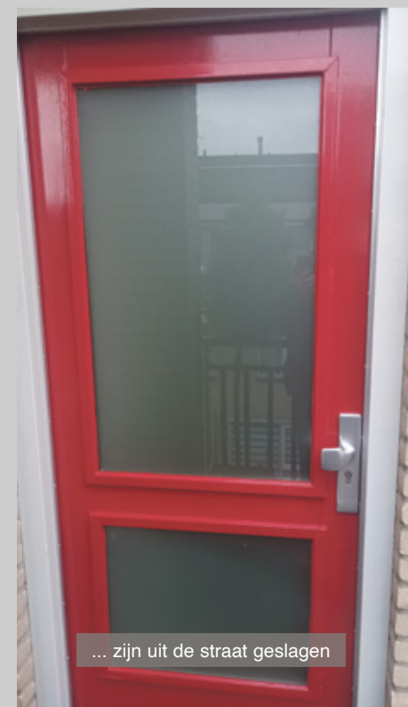
... zijn uit de straat geslagen

De straat heeft klappen gekregen, de voortanden zijn eruit geslagen. Het zal nog een tijdje duren voor we weer wat blosjes op de wangen krijgen.