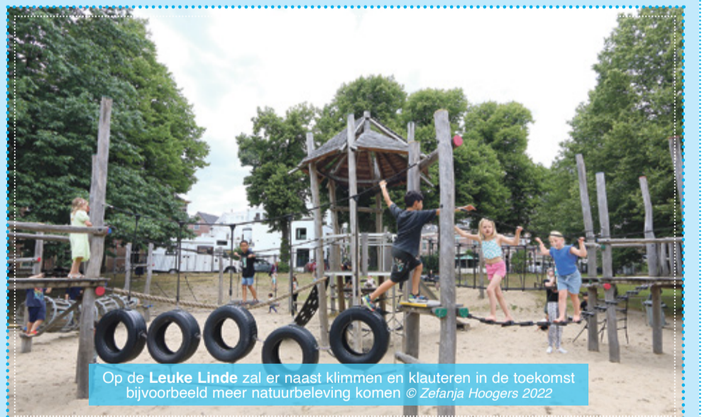
Op de Leuke Linde zal er naast klimmen en klauteren in de toekomst bijvoorbeeld meer natuurbeleving komen

Ondertussen is er vlak daarna een website gelanceerd, arnhem-oost.nl – 'Samen vooruit', waar je je kunt aanmelden voor een nieuwsbrief. We wisten al dat het Arnhemse programma nationaal was genoemd, omdat het samenloopt met het Nationaal Programma Leefbaarheid en Veiligheid vanuit het Rijk en het ministerie van Binnenlandse zaken dat 20 gebieden aan heeft gewezen voor dit programma. In de eerste NPAO nieuwsbrief wordt verteld dat ook ander geldstromen toegevoegd kunnen worden aan het programma: 'Op 12 december viel het verlossende woord: de aanvraag voor de tweede tranche van het Volkshuisvestingsfonds is gehonoreerd.'