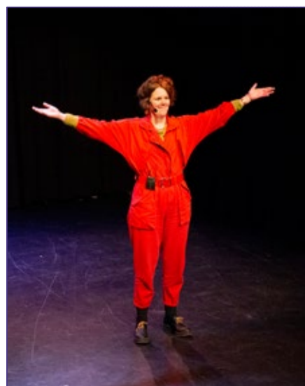
TOT ZIENS BIJ HUIS VAN PUCK!