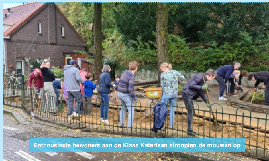
Enthousiaste bewoners aan de Klaas Katerlaan stroopten de mouwen op

Trouwens: Arnhem heeft het NK TEGELWIPPEN GEWONNEN! Deze editie hebben in Arnhem meer dan 460.000 tegels plaatsgemaakt voor nieuw groen. Dat is dezelfde oppervlakte als het GelreDome! Klarendal heeft daar zéker aan bijgedragen, bijvoorbeeld aan de Klaas Katerlaan.