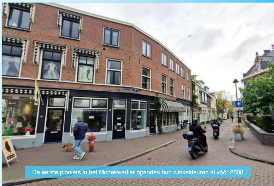
De eerste pioniers in het Modekwartier openen hun winkeldeuren al vóór 2008

Allen dank voor de bedrijvigheid in Klarendal, succes met verdere creativiteit en welkom nieuwe ondernemers!