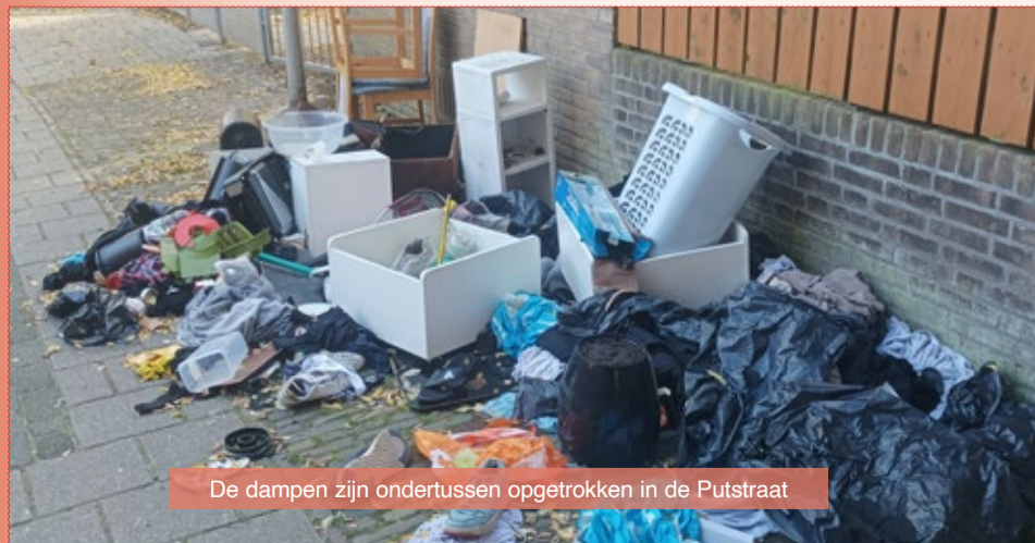
De dampen zijn ondertussen opgetrokken in de Putstraat

Nu de dampen zijn opgetrokken, rest er een verdrietig onderbuikgevoel gelardeerd met een vertrouwd vleugje putlucht. Gelukkig is buurman er ook nog steeds.