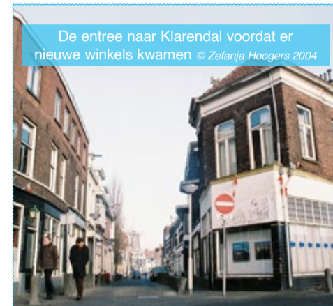
De entree naar Klarendal voordat er nieuwe winkels kwamen

Op 30 november 2023 is het tien jaar geleden dat Volkshuisvesting De GOUDEN PIRAMIDE won. De rijksprijs voor inspirerend opdrachtgeverschap op het gebied van architectuur en gebiedsontwikkeling werd uitgereikt voor het project Klarendal MODEKWARTIER/100% XL en was de toef op de taart van de grote transitie die de woningbouwvereniging samen met bewoners, ondernemers en de gemeente Arnhem in Klarendal teweegbracht.