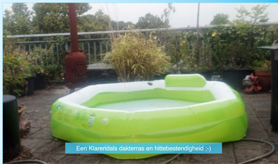
Een Klarendals dakterras en hittebestendigheid ;-)

Je kan je er natuurlijk op voorbereiden, op de hitte. Iets zegt me al jaren dat het er niet beter op gaat worden. In mijn hoofd neem ik al jaren maatregelen. Rolluiken, zonwering, ventilatoren en zelfs airco passeren ieder jaar weer de revue. Maar elke keer ben ik te laat, elke keer overvalt me de hitte, elke keer is de hitte me te snel af. Iedere keer voltrekt zich hetzelfde scenario, met dichte gordijnen, nachtelijk luchten en natte lakens hoop ik de hitte te slim af te zijn. Het betekent hooguit een paar dagen uitstel. Telkens weer eindig ik in windstille nachten met temperaturen van boven de 30 op mijn dakter-assende balkon, ijsjesvretend kijken