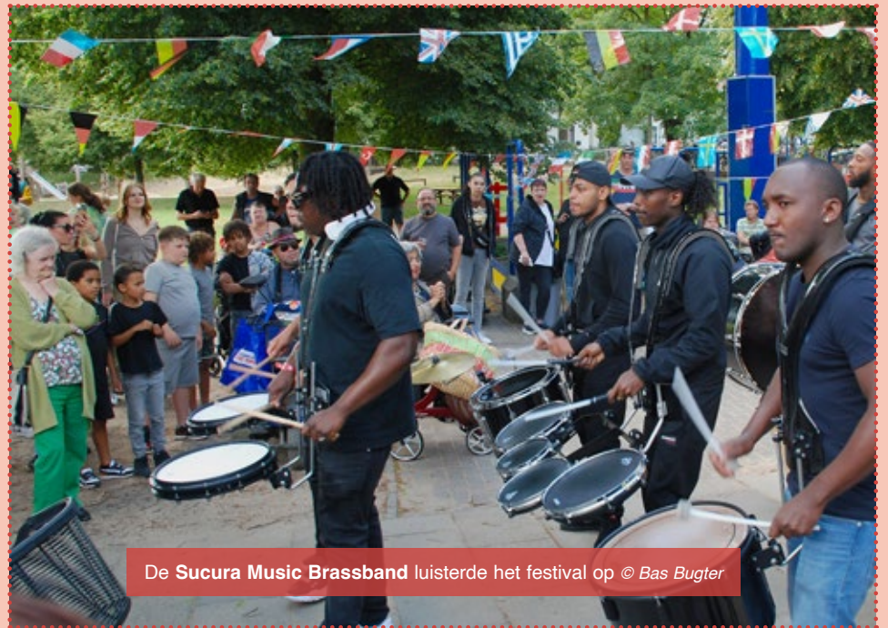
De Sucura Music Brassband luisterde het festival op

Keti Koti betekent 'Ketenen Verbroken' en is de reactie van voorbijgangers op de onthulling van het beeld, dat ter herdenking van de afschaffing van de slavernij in 1963 in Paramaribo werd onthuld. Sindsdien staat Keti Koti voor herdenken van het slavernijverleden. Met de pijnlijke geschiedenis wordt nog steeds ongemakkelijk om gegaan en speelt bovendien vandaag de dag nog een rol in het leven van veel mensen. De aandacht voor Keti Koti en excuses moeten bijdragen aan een verdraagzamere samenleving.