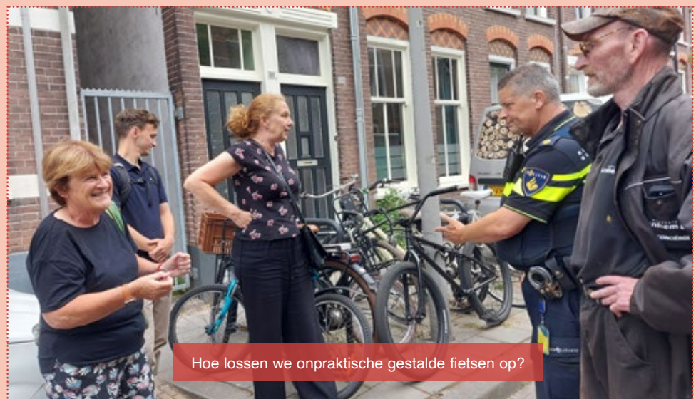
Hoe lossen we onpraktische gestalde fietsen op?

Met de opbrengsten uit een wijkschouw, wordt er altijd geprobeerd in oplossingen te denken.