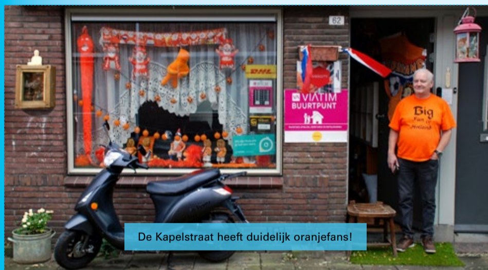
De Kapelstraat heeft duidelijk oranjefans!

In 2004 was de Klarendalse wijkkrant nog een blad met één steunkleur. Het was voorjaar toen het EK voetbal startte en de redactie maakte voor het eerst een editie met een andere steunkleur dan het traditionele blauw: oranje, om de collectieve oranjekoorts in de wijk te eren. Enorm veel straten waren behangen met oranje slingers en de meest mogelijke attributen. Bij het ter perse gaan van die editie, wisten we nog niet hoe het Nederlands elftal er voor zou staan bij het verschijnen van de krant. We verloren in de halve finale van Portugal.