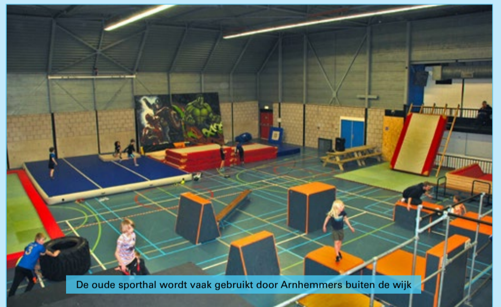
De oude sporthal wordt vaak gebruikt door Arnhemmers buiten de wijk