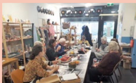
De dames van de handwerkgroep zijn al heel lang bezig is met een mooie kerststal die ondertussen in de etalage van de wasplaats staat te pronken

oogst@dewasplaats.nl voor meer informatie en de voorwaarden voor inschrijving.