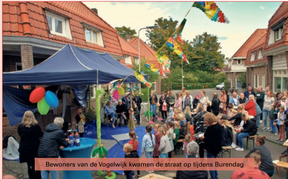
Bewoners van de Vogelwijk kwamen de straat op tijdens Burendag

Rond Pasen deed ze een A4-tje bij buurtgenoten in de bus waarop een tekening van een ei stond afgebeeld, die kon worden ingekleurd. Kinderen werden daarmee uitgenodigd deel te nemen aan een paasspeurtocht. Op Koningsdag hield men er een kledjesmarkt-voor-de-deur.