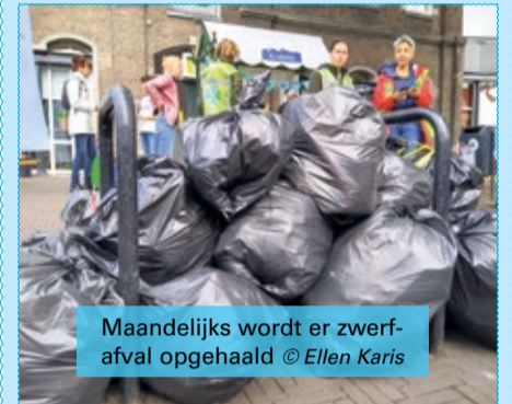
Maandelijks wordt er zwerfafval opgehaald

Wil jij je samen met andere wijkbewoners inzetten voor een schone wijk? Doe eens mee met een opschoonactie of help de Poepgroep met positieve acties voor minder hondenpoep in de wijk. Deze werkgroepen zijn te bereiken via respectievelijk schoonklarendal@outlook.com en klarendalsepoepgroep@gmail.com .