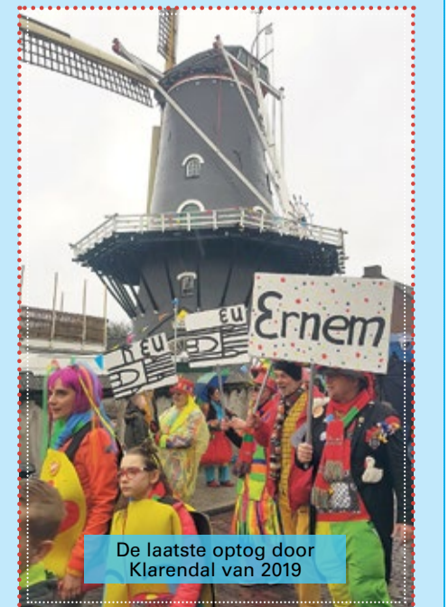
De laatste optog door Klarendal van 2019

Volgend carnaval valt iets vroeger. Als alles goed gaat, hoeven fans dus minder lang te wachten tot 19 februari 2023 als de volgende optog door de wijk kruipt.