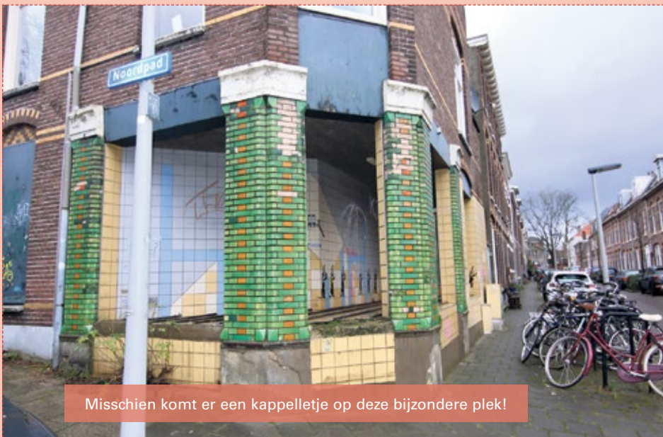
Misschien komt er een kappelletje op deze bijzondere plek!