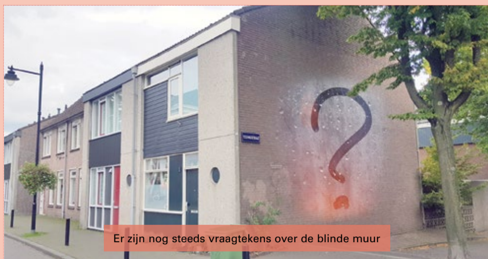
Er zijn nog steeds vraagtekens over de blinde muur