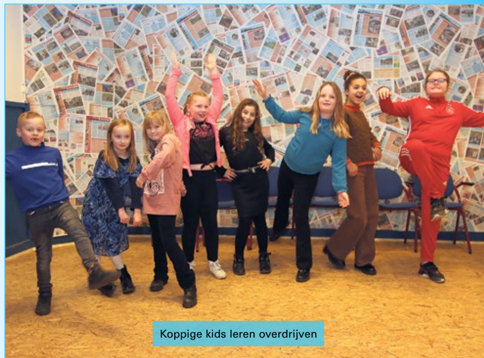
Koppige kids leren overdrijven