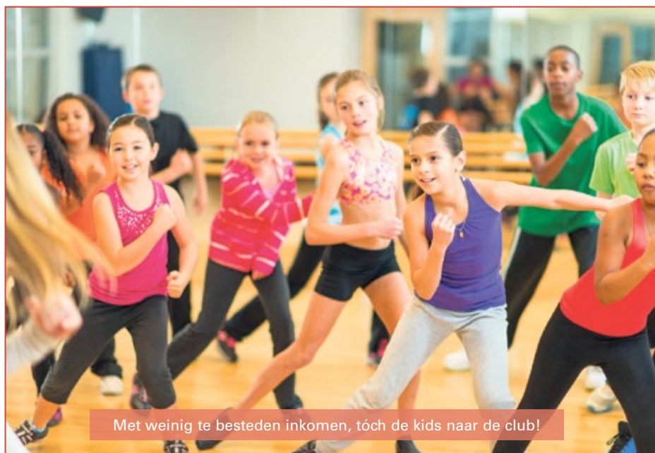
Met weinig te besteden inkomen, tóch de kids naar de club!