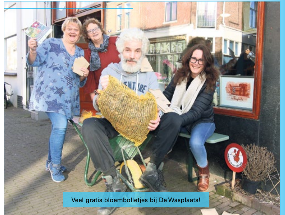
Veel gratis bloembolletjes bij De Wasplaats!

Op weg uit de Corona-ellende, buiten nog fris