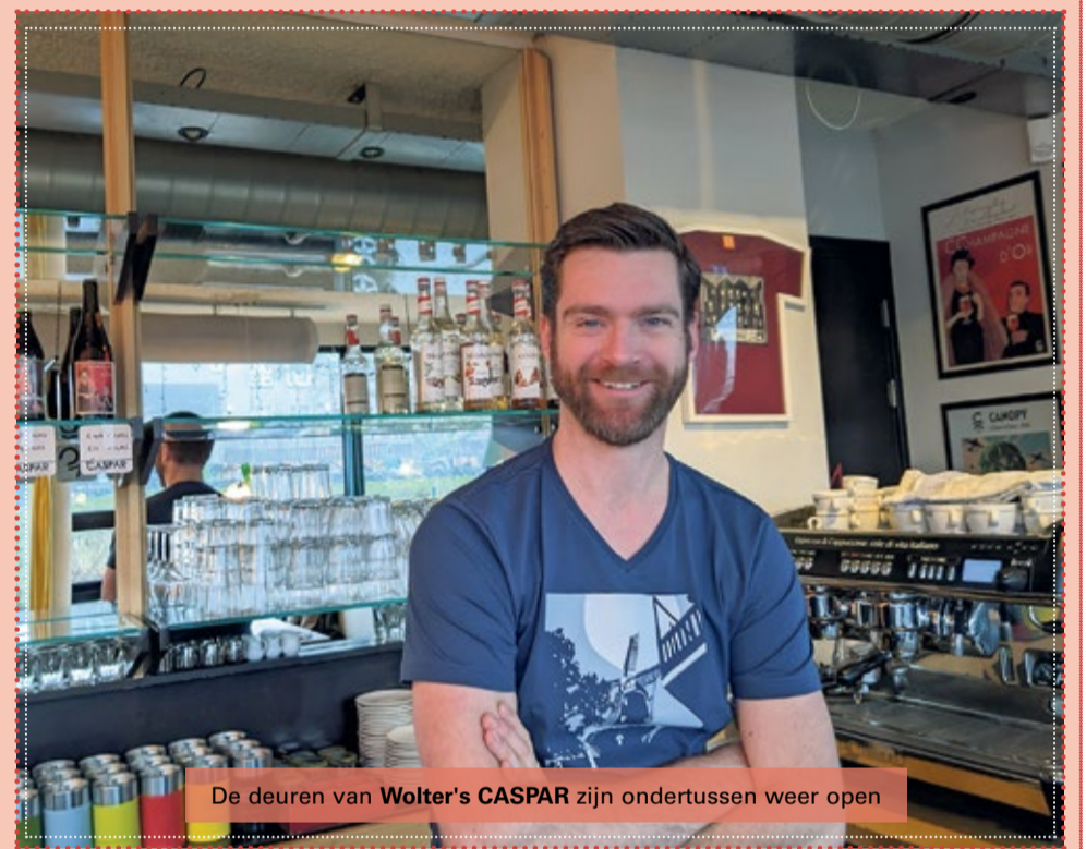
De deuren van Wolter's CASPAR zijn ondertussen weer open

"Ik lees de krant graag en vindt het mooi dat de krant oog heeft voor alle 'groepen' in de wijk. In al die jaren dat ik hier woonde en werk is de wijk veranderd, maar een ding is niet veranderd; de betrokken-