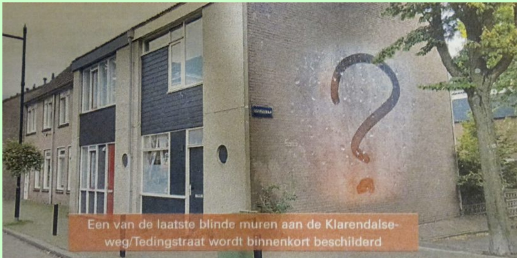
Afbeelding: Wijkkrant Klarendal