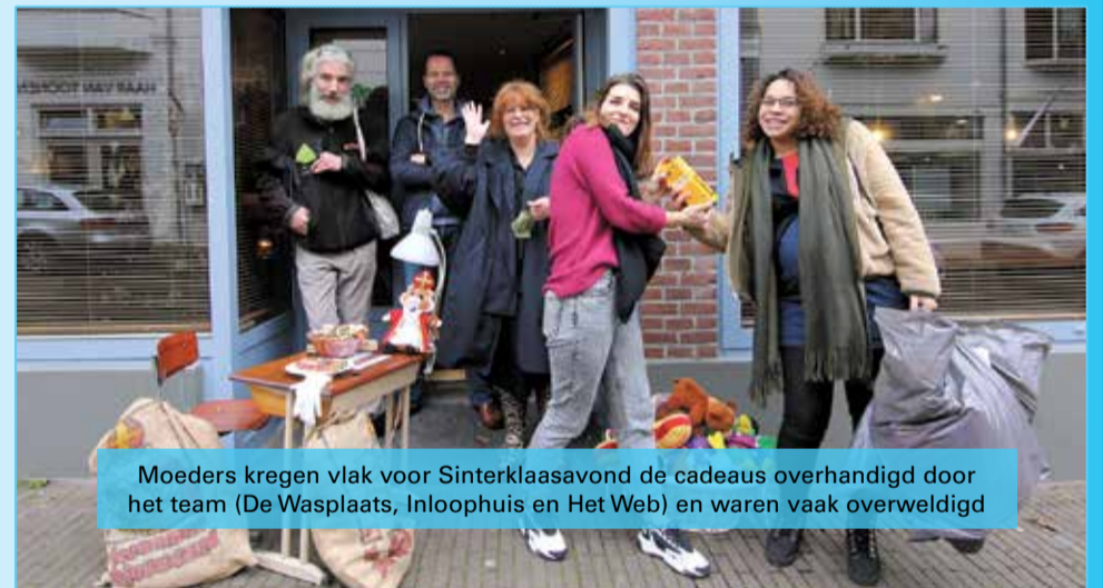
Moeders kregen vlak voor Sinterklaasavond de cadeaus overhandigd door het team (De Wasplaats, Inloophuis en Het Web) en waren vaak overweldigd

Ritmiek Dans en Muziek is zeker nog actief in Klarendal. Zij leverden óók cadeau pakketten aan de actie!