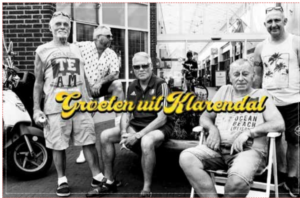
De heren op de foto worden met toestemming 'de Sopranos' genoemd. Ze hebben de ansichtkaarten als eersten overhandigd gekregen en waren erg dankbaar: 'Zo mooi! Dit maak je maar één keer in je leven mee...'

In deze tijd waar meer mensen met eenzaamheid kampen, is het vooral de bedoeling dat wijkbewoners ze gaan versturen.