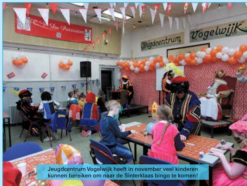
Jeugdcentrum Vogelwijk heeft in november veel kinderen kunnen bereiken om naar de Sinterklaas bingo te komen!