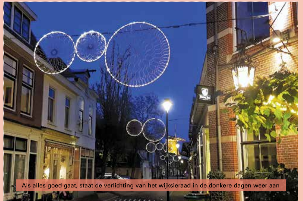
Als alles goed gaat, staat de verlichting van het wijksieraad in de donkere dagen weer aan

Deze maand wordt met een hoogwerker aan de touwtjes getrokken om het op bepaalde punten te herstellen, waardoor Klarendal tijdens de donkere dagen zeker weer verlichting boven de winkelstraten heeft!