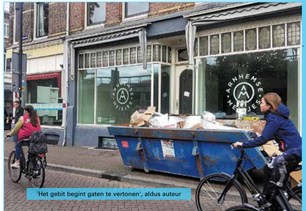
'Het gebit begint gaten te vertonen', aldus auteur

We weten het niet meer. Nog steeds trekken we ons op aan de vergane glorie van