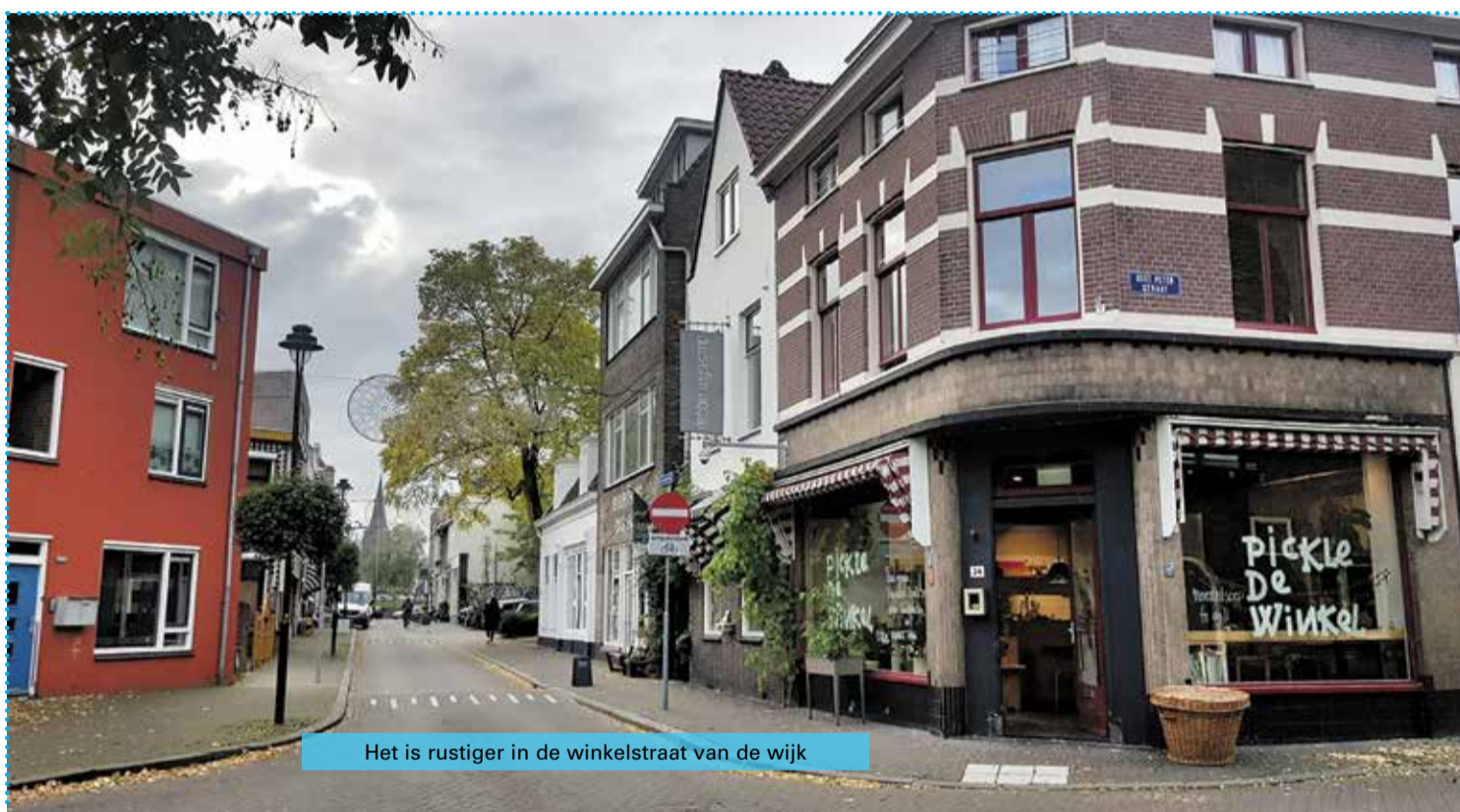
Het is rustiger in de winkelstraat van de wijk

We wachten weer af wat het virus Covid-19 nog meer in petto heeft. We hopen natuurlijk zo weinig mogelijk.