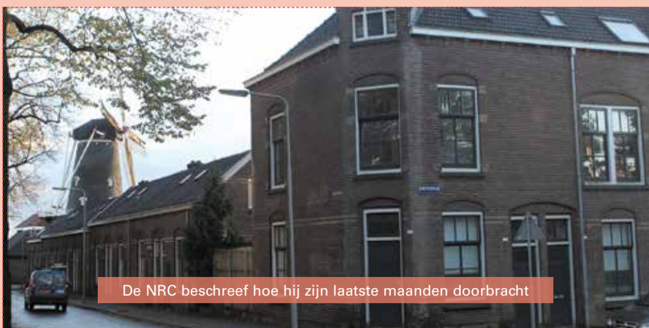
De NRC beschreef hoe hij zijn laatste maanden doorbracht