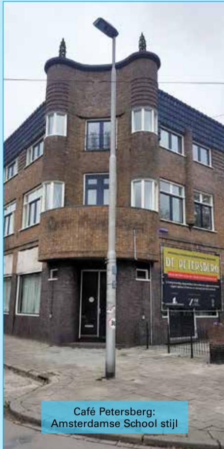
Café Petersberg: Amsterdamse School stijl

Bronnen: amsterdamse-school.nl, wijkkrant Klarendal editie 1/2013.