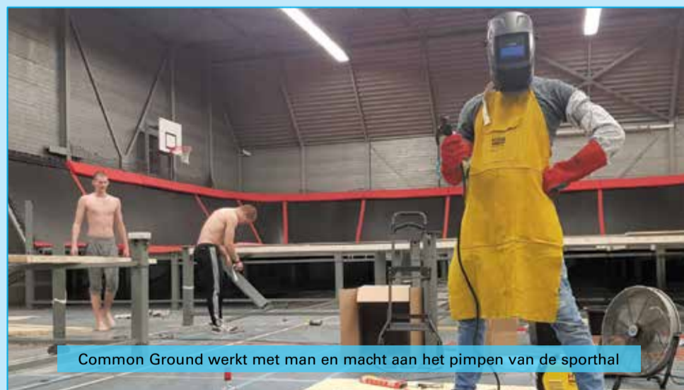
Common Ground werkt met man en macht aan het pimpen van de sporthal

In januari meldde zich de nieuwe gebruiker Common Ground: Freerunning, Tricking,