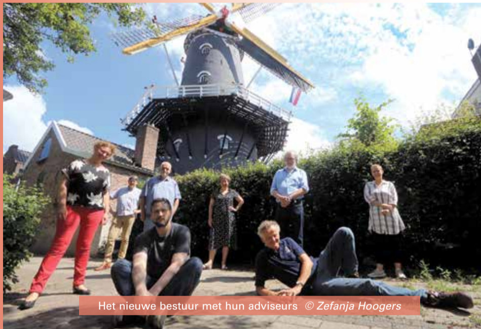
Het nieuwe bestuur met hun adviseurs