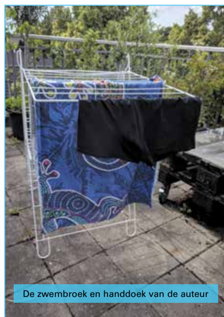
De zwembroek en handdoek van de auteur

Inmiddels zijn de douches geopend, wat een genot zo'n meditatieve straal op je kop. Zo'n straal doet je dromen en inspireert me om columns schrijven. Wat een mooi en poëtisch einde zou het geweest zijn als dit stukje me juist daar zou zijn ingestraald. Het had zo maar gekund. Maar goed we zwemmen weer, mijn buuf en ik, omdat het water lonkt en de buik erom vraagt.