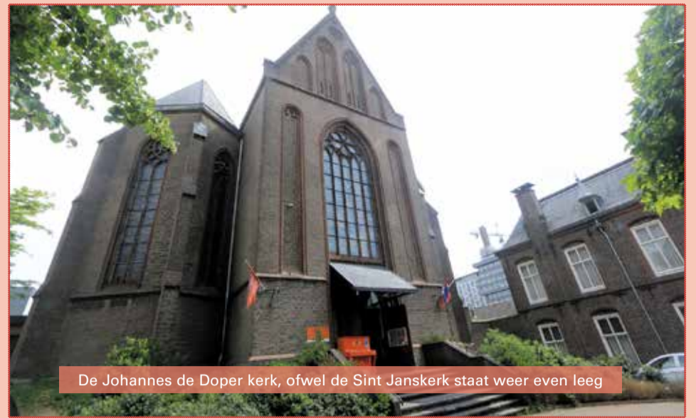
De Johannes de Doper kerk, ofwel de Sint Janskerk staat weer even leeg

Onze lessen verhuizen naar andere locaties in de wijk. Onze muzieklessen zullen