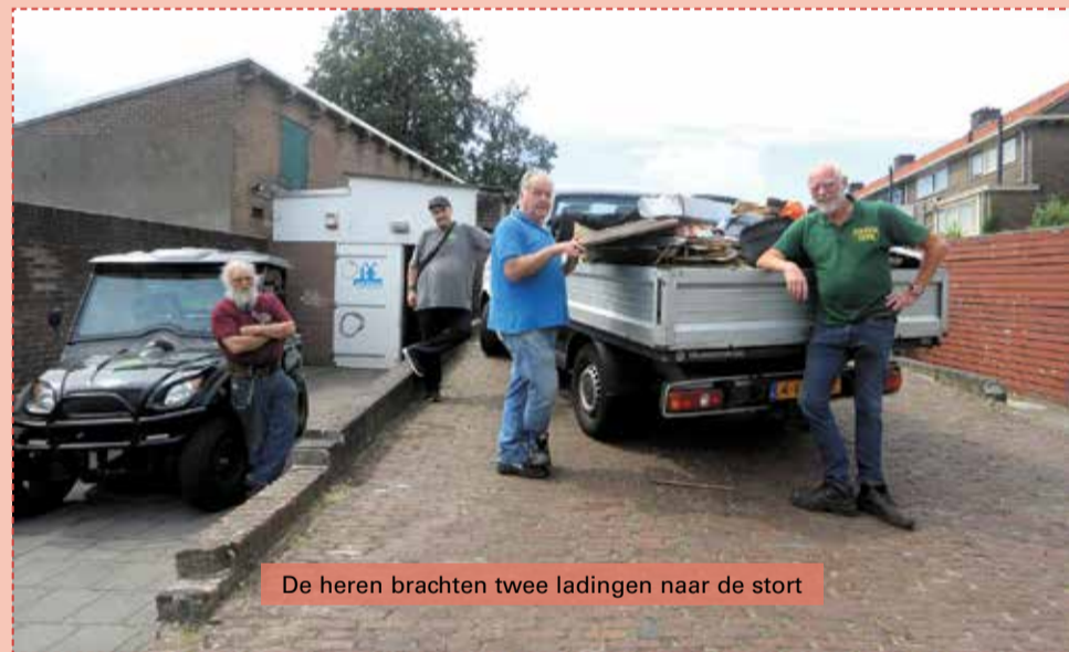
De heren brachten twee ladingen naar de stort

De afgelopen maanden is de vervuiling hand over hand toegenomen en de buurt is het zat. Bij het afvalwegbrengstation zijn de heren bekend en het idee is: hoe opgeruimder de wijk, hoe minder bewoners vuil dumpen.