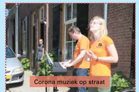
Corona muziek op straat