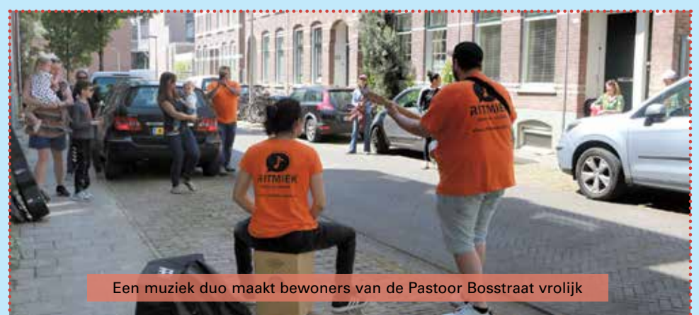
Een muziek duo maakt bewoners van de Pastoor Bosstraat vrolijk