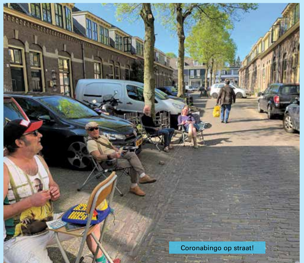
Coronabingo op straat!

Het bingo molentje was een speelgoedmodelletje hamstermolen met piepkleine balletjes. Mijn vingers bleken toch wat dikkig voor dit delicate werk. Het bleef een beetje klungelen. Dan maar een keeltje opzetten. De techniek van het omroepen is er een van intonatie en grote afwisseling. Ik kreeg de smaak te pakken, ACHTENZESTIG , achtenZESTIG , ACHTENZESTIG!!! Er sloten steeds meer straatgenoten aan, het werd verdomme nog druk ook. Stoelen werden aangesleept, voorbijrijdende auto's riepen steevast valse bingo's en uiteindelijk ging