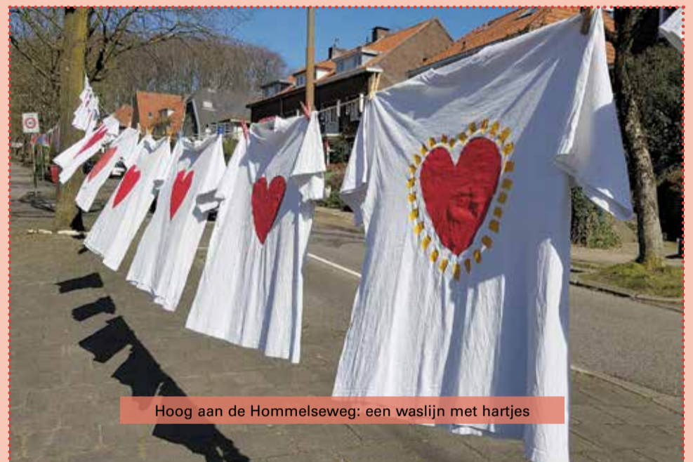
Hoog aan de Hommelseweg: een waslijn met hartjes

vermijden van fysiek contact, thuis blijven en handen wassen. Aan het Putplein hangt zelfs vanaf het balkon een prachtig spandoek! Mèt 'SAMEN STERK!' Ook in Klarendal zijn net als in de rest van het land, hartjes in de ramen getroffen geprint op T-shirts of gewoon op de ramen