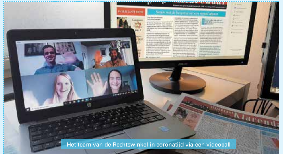
Het team van de Rechtswinkel in coronatijd via een videocall

Doordat verschillende ruimtes binnen het MFC van Klarendal na de zomervakantie door nieuwe en andere huurders in gebruik zijn, is er een probleem gekomen met de opslagkast van Rechtswinkel Arnhem waar