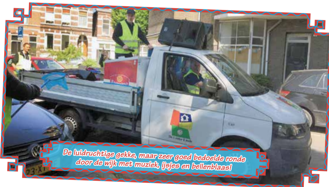
De luidruchtige gekke, maar zeer goed bedoelde ronde door de wijk met muziek, ijsjes en bellenblaas!

Ik mis school en mijn vriendjes. Ik zie ze wel tijdens de onlinelessen van school, maar dat is toch niet hetzelfde. Alle kinderen van school hebben een kaartje van de juffen en meesters gekregen, dat is wel heel lief!"