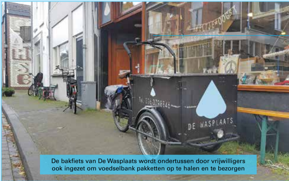
De bakfiets van De Wasplaats wordt ondertussen door vrijwilligers ook ingezet om voedselbank pakketten op te halen en te bezorgen

Bij de entree zullen materialen aanwezig zijn om handen te ontsmetten. We hopen binnenkort op uitbreiding, doe voorzichtig, pas op jezelf!