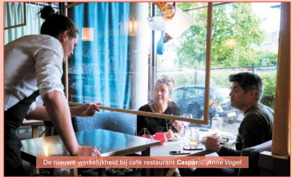
De nieuwe werkelijkheid bij café restaurant Caspar

Ondertussen zijn zij met VOLKSHUIS-VESTING ARNHEM in gesprek over het (niet kunnen) betalen van de huur. 'Voor veel van ons is dat op het moment een zware opgave. We denken dat, door dit samen te doen vanuit DOCKS (ondernemersvereniging, red.), voor zowel leden als