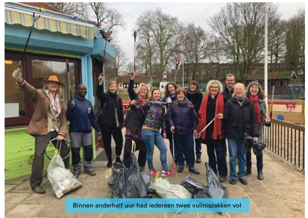
Binnen anderhalf uur had iedereen twee vuilniszakken vol

De opruimactie was een initiatief van Schoon Klarendal, ondersteund door het KinderWijkTeam.