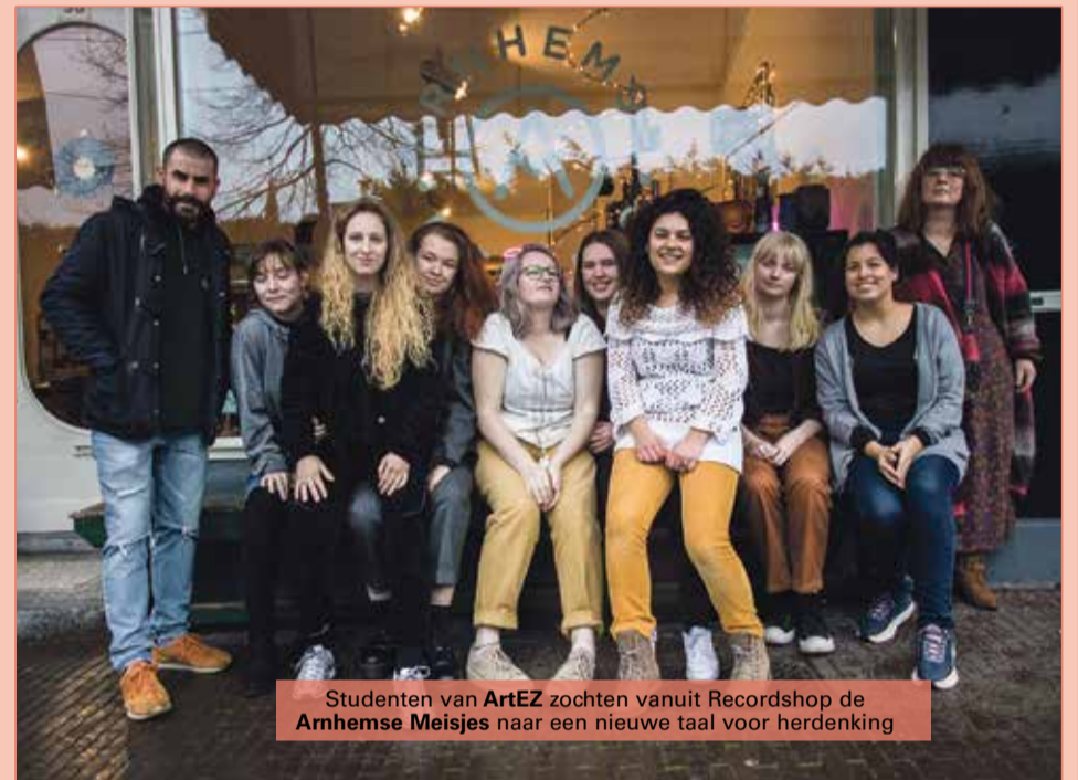
Studenten van ArtEZ zochten vanuit Recordshop de Arnhemse Meisjes naar een nieuwe taal voor herdenking

De muziekcollectie is te beluisteren via Spotify -> https://spoti.fi/2TLrih1