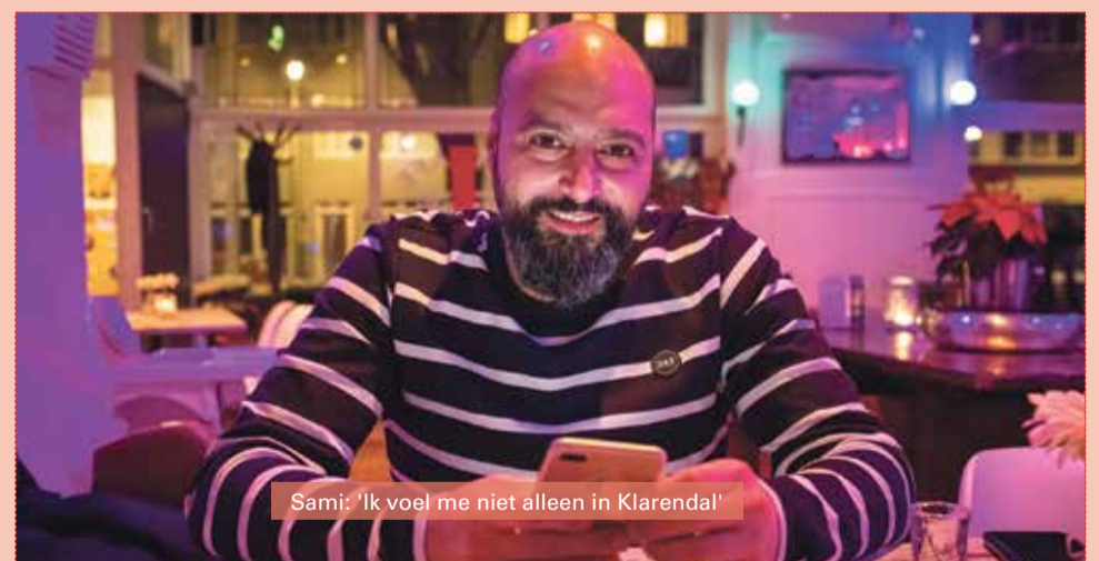
Sami: 'Ik voel me niet alleen in Klarendal'

Het was niet per se het plan om naar Nederland te gaan. Voor mij is thuis een plek waar het veilig is. Het maakt me niet uit of dat in Nederland, Duitsland of Canada is. Weet je wat grappig is? Toen ik nog in Damascus woonde, had ik vanuit mijn balkon uitzicht op de Nederlandse ambassade en zag dus altijd de Nederlandse vlag wapperen. Nu ben ik hier. Toeval! Ik kwam aan in Ter Apel en ben vanuit daar Nijmegen gestuurd. Ik heb een tijdje in Heumesoord gewoond. Ik ontmoette daar een journalist en ik vertelde haar mijn idee om een film te maken over vluchtelingen. Ik wilde graag aan Neder-