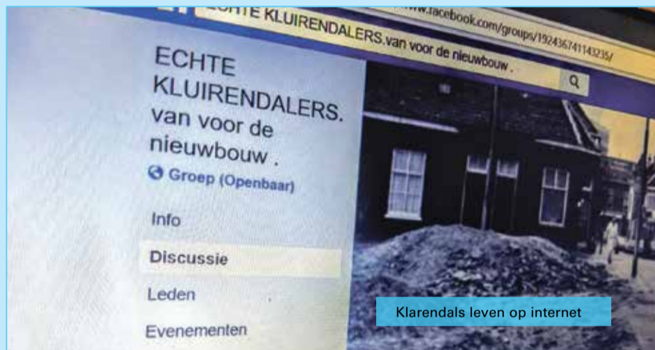
Klarendals leven op internet