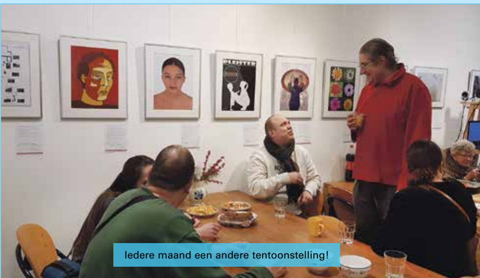
Iedere maand een andere tentoonstelling!

In februari hangen er schilderijen van GULAY YILDRIM in De Wasplaats en wij zijn ondertussen óók op de zaterdagen open van 10.00u tot 16.00u!