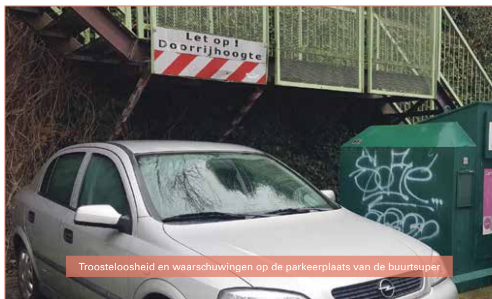
Troosteloosheid en waarschuwingen op de parkeerplaats van de buurtsuper

Een enkele keer ben ik wat later. De parkeerplaats is bijna verlaten. Een verwaald deeltje van een handelaar trekt mijn aandacht. Ze doen hun best om er professioneel uit te zien. De onopvallende dure auto met spoilers, de nerveus heen en weer lopende sukkel wachtend op een teken om in te stappen, het korte samenzijn en het camouflage loopje dat de aftocht dekt. Ik grijns en start de auto om huiswaarts te keren. Langzaam glijd ik de parkeerplaats af en passeer mijn eigen binnenpretje. Op amper een meter afstand van de meest ondringbare muur in de wijk hangt een bord dat waarschuwt voor de maximale doorrijhoogte. De ideale plek om eens lekker te gassen.