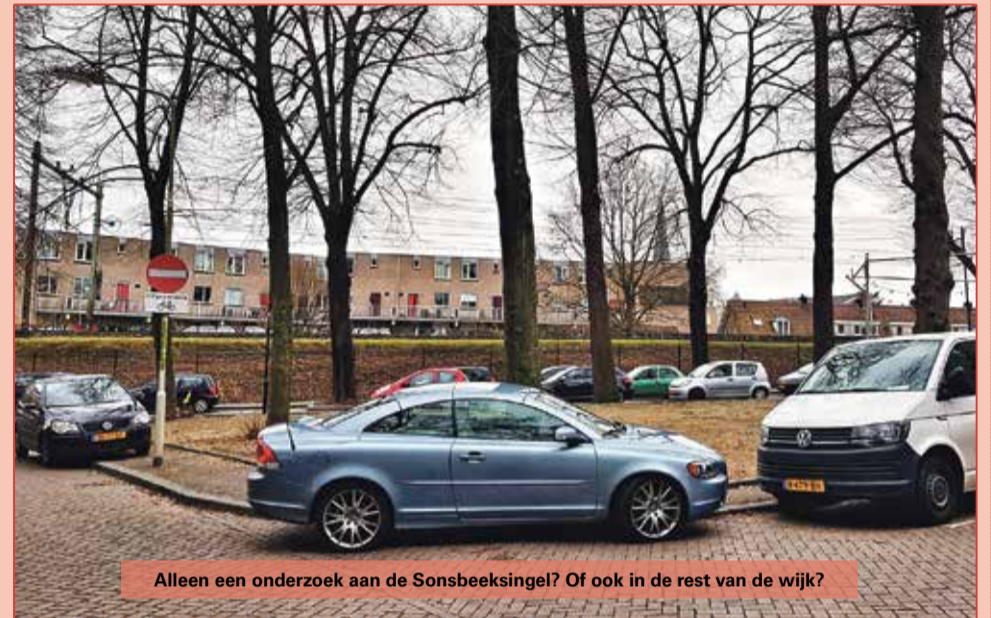
Alleen een onderzoek aan de Sonsbeeksingel? Of ook in de rest van de wijk?