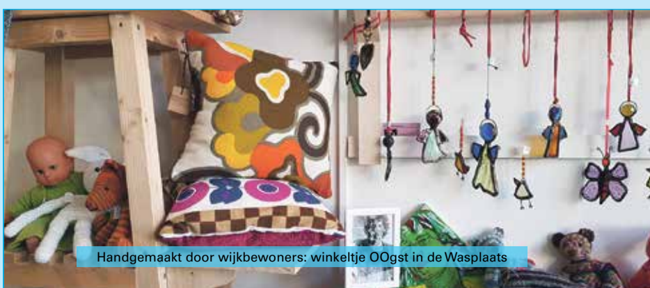
Handgemaakt door wijkbewoners: winkeltje Oogst in de Wasplaats