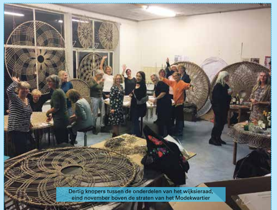
Dertig knopers tussen de onderdelen van het wijksieraad, eind november boven de straten van het Modekwartier