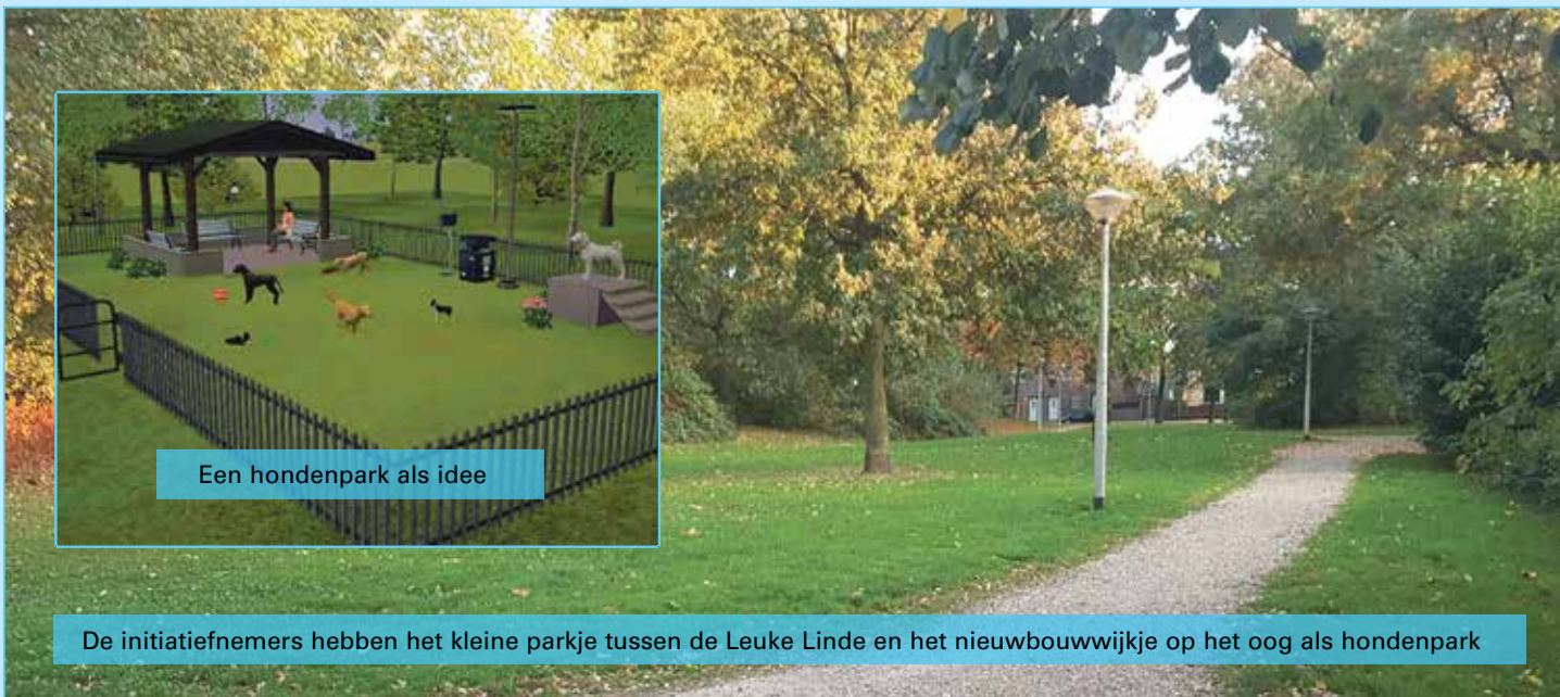
Een hondenpark als idee

Op de website www.hondendelinde.nl is alles na te lezen, alsook de stand van zaken na het tweede overleg met de gemeente. Via hondendelinde@outlook.com is contact te maken met de initiatiefnemers van dit idee: 'Natuurlijk is het voor ons wel fijn om te weten waarom u het wel of niet een leuk idee vindt. Uw mening is voor ons erg belangrijk.'