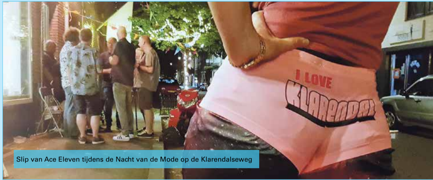
Slip van Ace Eleven tijdens de Nacht van de Mode op de Klarendalseweg