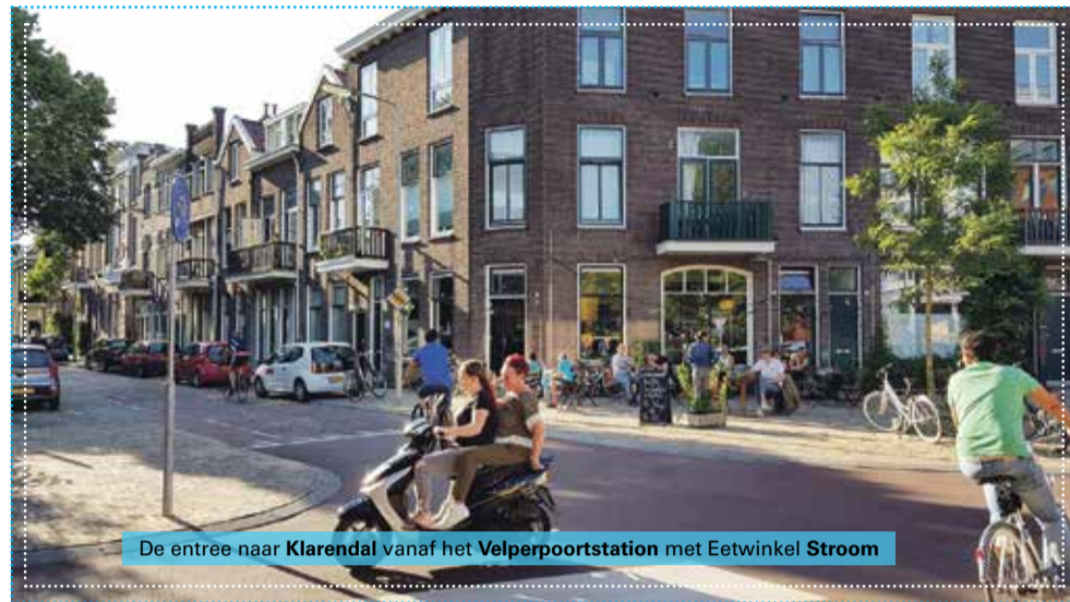
De entree naar Klarendal vanaf het Velperpoortstation met Eetwinkel Stroom

In 2016 kondigt de gemeente eindelijk zijn verbeterplannen aan, de Gelderlander kopt dat dit 'Het slechtste station van Oost-Nederland' is en in 2017 starten de werkzaamheden aan beide kanten van het station. Loop- en fietsroutes werden logischer en herkenbaar aangelegd. Ook aan de Klaren-