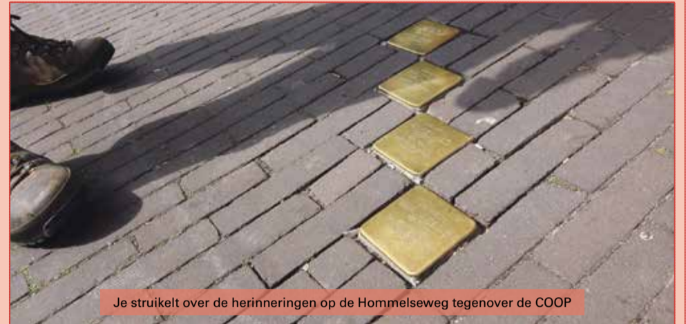
Je struikelt over de herinneringen op de Hommelseweg tegenover de COOP