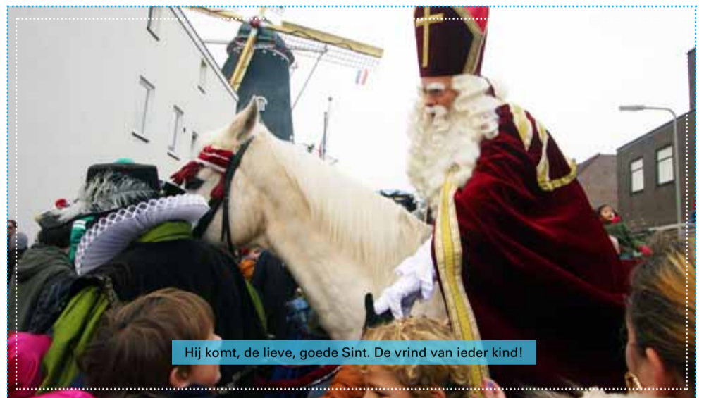
Hij komt, de lieve, goede Sint. De vriend van ieder kind!

Het bestuur en de vrijwilligers van Bouwspelplaats de Leuke Linde vinden het ontzettend jammer voor de kinderen uit de wijk Klarendal en organiseert daarom zelf een sinterklaasoptocht door de wijk!