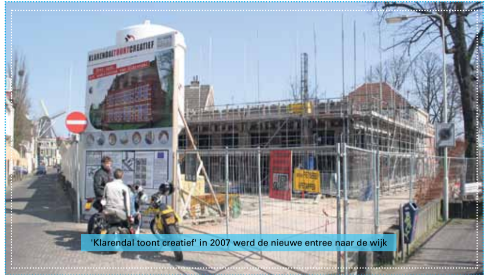
'Klarendal toont creatief' in 2007 werd de nieuwe entree naar de wijk

Klarendal staat op een kruispunt. Blijft het een volkswijk of wordt het een wijk voor de elite? Met andere woorden, wie wonen er over tien jaar in Klarendal? Blijven modewinkels het beeld aan de Klarendal-seweg bepalen? Of moet er meer ruimte komen voor maakateliers en ambachten? Voor meer cafés en restaurants? Of vooral wonen en spelen? En hoe doen we dat: bouwen we aan een nieuwe vorm van wijkgericht werken, of doen we het anders? Tijdens de avond houden we een peiling over waar het heen zou moeten gaan met Klarendal.