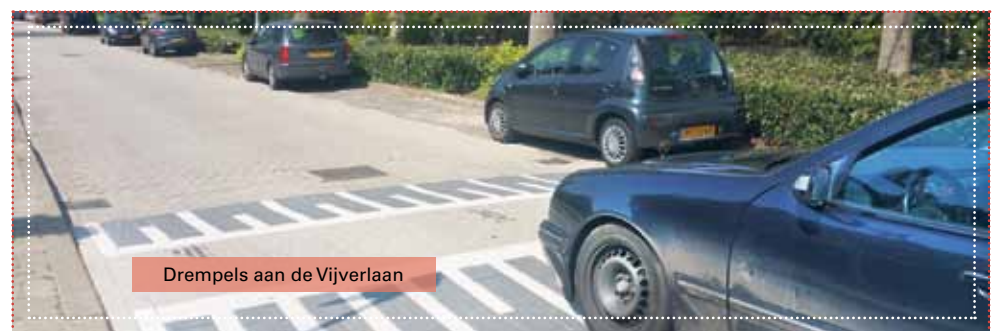
Drempels aan de Vijverlaan