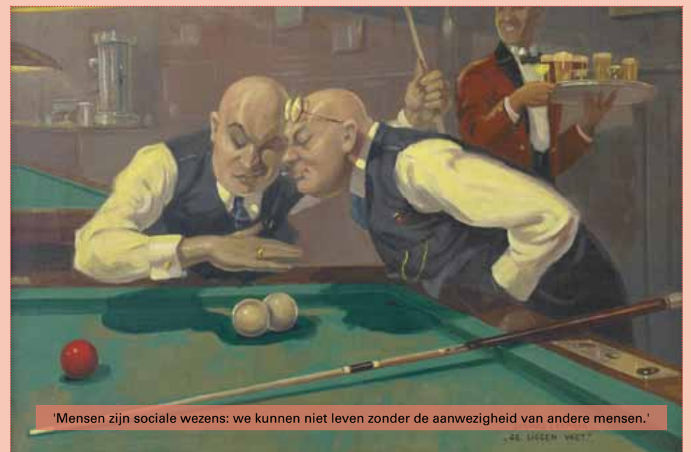
'Mensen zijn sociale wezens: we kunnen niet leven zonder de aanwezigheid van andere mensen.'

Biljart Centrum Snelpost Agnietenstraat 88b Telefoon: 06 - 437 84 790 E-mail: j.knoopslubbers@upcmail.nl