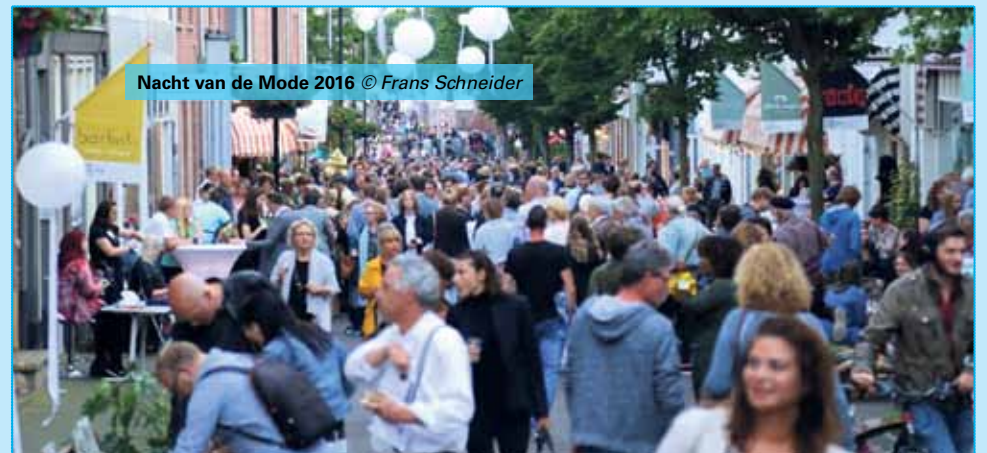
Nacht van de Mode 2016