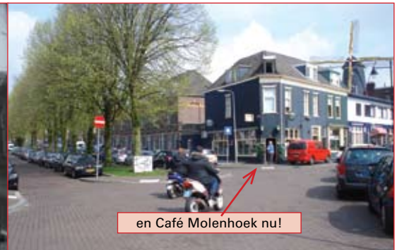
en Café Molenhoek nu!