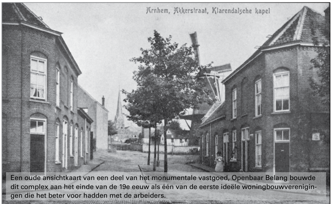
Een oude ansichtkaart van een deel van het monumentale vastgoed, Openbaar Belang bouwde dit complex aan het einde van de 19e eeuw als één van de eerste ideële woningbouwverenigingen die het beter voor hadden met de arbeiders.

De overdracht betreft monumentale eengezinswoningen aan de Agnietenstraat, Landbouwstraat, Oogststraat, Warmoestraat, Veldstraat, Paulstraat, Catharijnestraat, Hovenierstraat, Koolstraat en Klarendalseweg. Tevens meerdere beneden- en bovenwoningen aan o.a. de Hovenierstraat, studentenkamers aan Koolstraat en Sonsbeeksingel en 55+ woningen aan de Catharijnestraat.