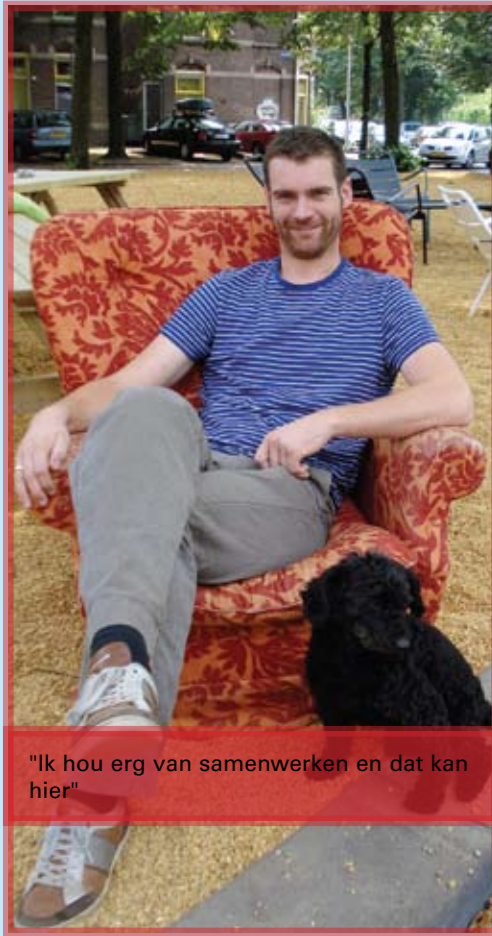
"Ik hou erg van samenwerken en dat kan hier"

'Wij zeiden altijd dat we aan het Putplein woonden, tot we op het gemeentehuis eens hoorden dat dat adres niet bestond. Sindsdien zeggen we Putstraat, behalve als we een taxi bestellen. Een chauffeur kent het Putplein veel beter, is onze ervaring.' Het echtpaar vond de jaren tachtig aan het plein de 'mindere' tijd. Heroïnehoertjes, zwervers, slechte huizen waar vooral studenten woonden. Er was weinig binding. Met de huidige burens hebben ze een goed contact. 'Met de café-eigenaar, de ontwerper naast ons, de hotelmanager, de restauranthouder achter ons... Als er problemen zijn, lossen we die samen op. De vrachtauto's die hier komen laden en lossen houden inmiddels rekening met ons. Van geluidsoverlast hebben we nog niks gemerkt. Ook omdat we extra isolerend glas hebben vanwege het spoor, maar ach, als we wel eens iets horen, nemen we dat voor lief. Daarom wonen we in de stad.'