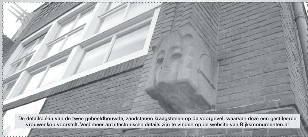
De details: één van de twee beeldhouwde, zandstenen kraagstenen op de voorgevel, waarvan deze een gestileerde vrouwenkop voorstelt. Veel meer architectonische details zijn te vinden op de website van Rijksmonumenten.nl

Zodra we meer weten over de toekomstige bestemming van dit rijksmonument, klimmen we weer in de pen!