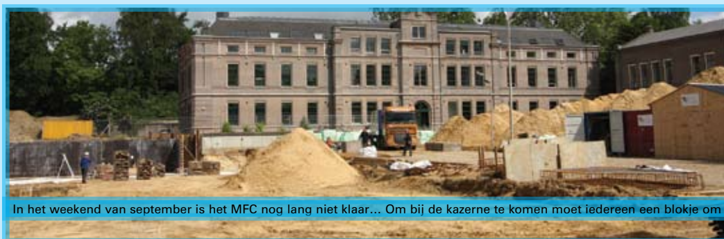
In het weekend van september is het MFC nog lang niet klaar... Om bij de kazerne te komen moet iedereen een blokje om

Op de zondag gaan beide organisaties de wijk in; THEATERFLASHMOBS op straat? SKYBOX , PLATENKEET , CUPROCKING ? Laat je verrassen!