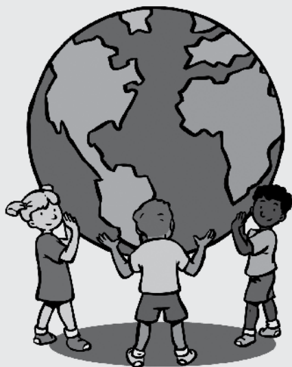
De Vreedzame School

De school is een plaats waar veel kinderen samenkomen; daarom is juist de school een goede oefenplaats en staat centraal bij deze methode!