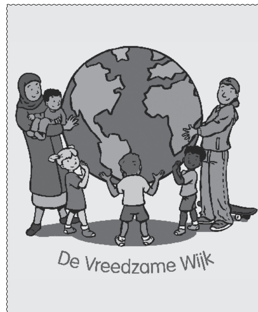
De Vreedzame Wijk

Dankzij subsidie van het Innovatiefonds Jeugd van de Gemeente Arnhem, het Onderwijsfonds VF/PF, de Wijkactieplannen van Klarendal en St. Marten/Sonsbeekkwartier en de brede school, is het mogelijk de Vreedzame School en Vreedzame Wijk in te voeren.