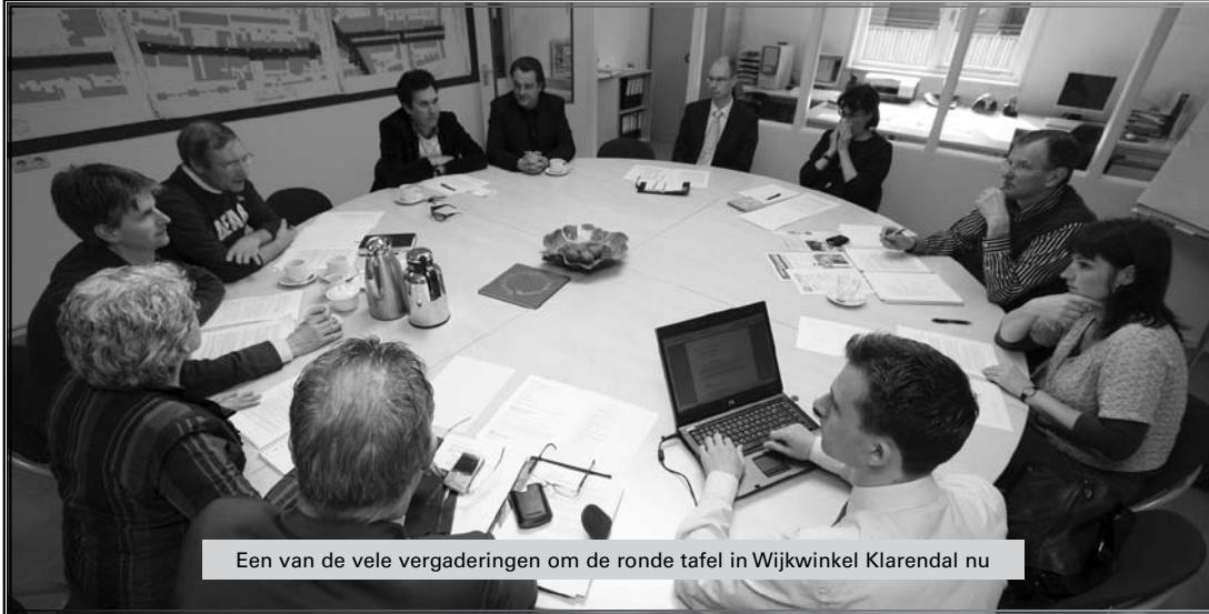
Een van de vele vergaderingen om de ronde tafel in Wijkwinkel Klarendal nu

Overigens konden Klarendallers nu bij de wijkwinkel ook al terecht voor informatie. Over de plek voor de opbouwwerker wordt in de brief niet gesproken. Vreemd is dat niet, want de opbouwwerker is in dienst van Stichting Rijnstad, die dus ook de werkplek in het MFC moet regelen.