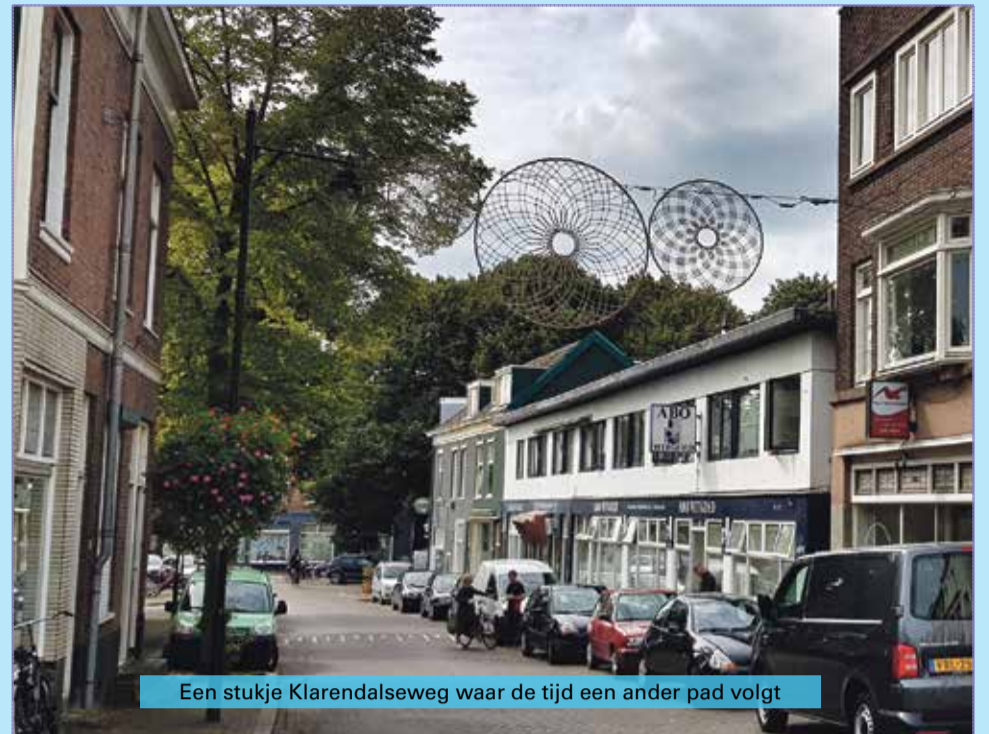
Een stukje Klarendalseweg waar de tijd een ander pad volgt

In het begin van de zaak van Seky staat een grote leren bank, wat burens waren er de dag door aan het nemen en voor ik het wist zat ik driftig mee te doen met een kop koffie in de hand. Ik voelde me thuis, op mijn gemak. Eenmaal in de zetel van Seky