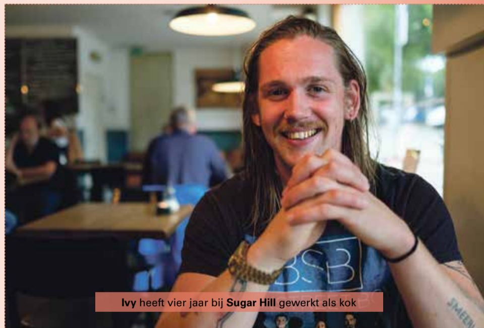
Ivy heeft vier jaar bij Sugar Hill gewerkt als kok

Die stinksok vind ik heel leuk. Omdat die niemand anders dat heeft. Verder, de echt mooiste vind ik de tattoo met de tekst 'We are lost in music'. Dat is een liedje van