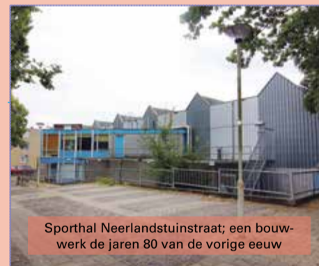
Sporthal Neerlandstuinstraat; een bouw-werk de jaren 80 van de vorige eeuw

Bij het realiseren van appartementen voor ouderen is het belangrijk dat 50% van deze appartementen onder de maximale huurgrens (sociale huur) beschikbaar komen. Het aantal appartementen dat mogelijk is, dient van te voren vastgesteld te worden.