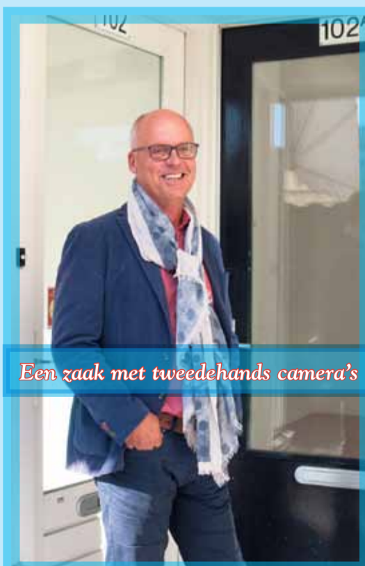
Een zaak met tweedehands camera's