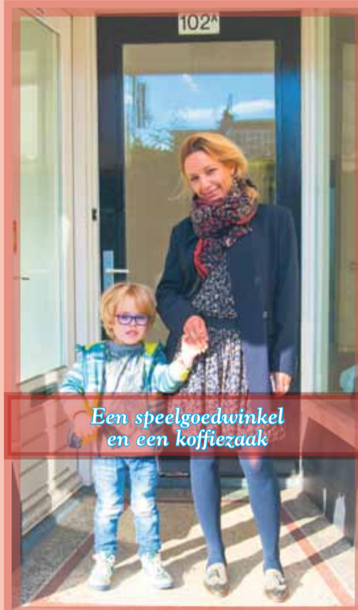
Een speelgoedwinkel en een koffiezaak

Misschien kunnen moeder en zoon samenwerken?