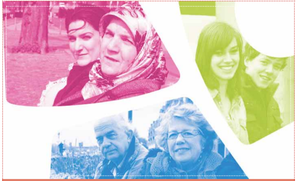
Omslagfoto van Rijnstad op Facebook

Maar voor de zomervakantie kondigde de gemeente aan sowieso te stoppen met