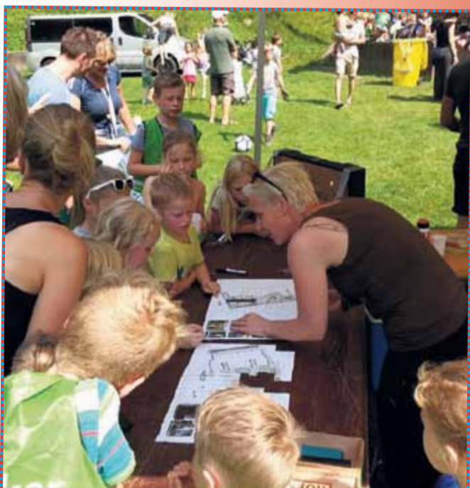
Tijdens zomerpicknick op de Ronde Weide is de crowdfunding gestart

Kijk voor meer informatie over de plannen op http://nieuwe-pleinen-jls.strikingly.com