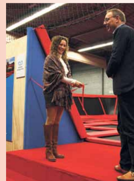
Loop gerust eens binnen om met eigen oog de nieuwe sportaccommodatie te bekijken.

De samenwerking tussen de gemeente Arnhem en Bounz Arnhem is verder een duidelijk voorbeeld van hoe een moderne samenwerking tussen gemeente en bedrijfsleven eruit kan zien met een sterke maatschappelijke betrokkenheid en dat zonder enige vorm van subsidie. Bounz® streeft naar een betrokken samenwerking waarin iedereen de kans krijgt om met plezier te bewegen. Bounz® is leuk, sportief en betrokken.