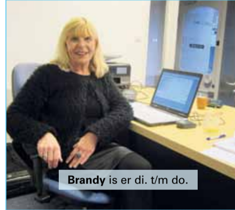
Brandy is er di. t/m do.

Brandy werkte zes jaar lang als wijkwinkelmedewerkster, maar ook die functie hield twee jaar geleden op te bestaan. Sindsdien werkt ze op de afdeling com-