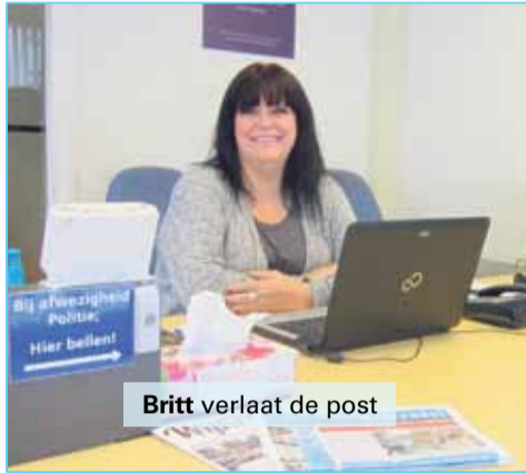
Britt verlaat de post

Het wijksteunpunt aan de Hommelseweg op de hoek met de Zuid Peterstaat, is de opvolger van de oude politiehuiskamer. Vanwege reorganisaties en ook de wens 'meer lichtblauw' op straat, is deze locatie vanaf 2011 (verhuisd en) geopend. Het wijksteunpunt is een samenwerking tussen de politie en de gemeente Arnhem.