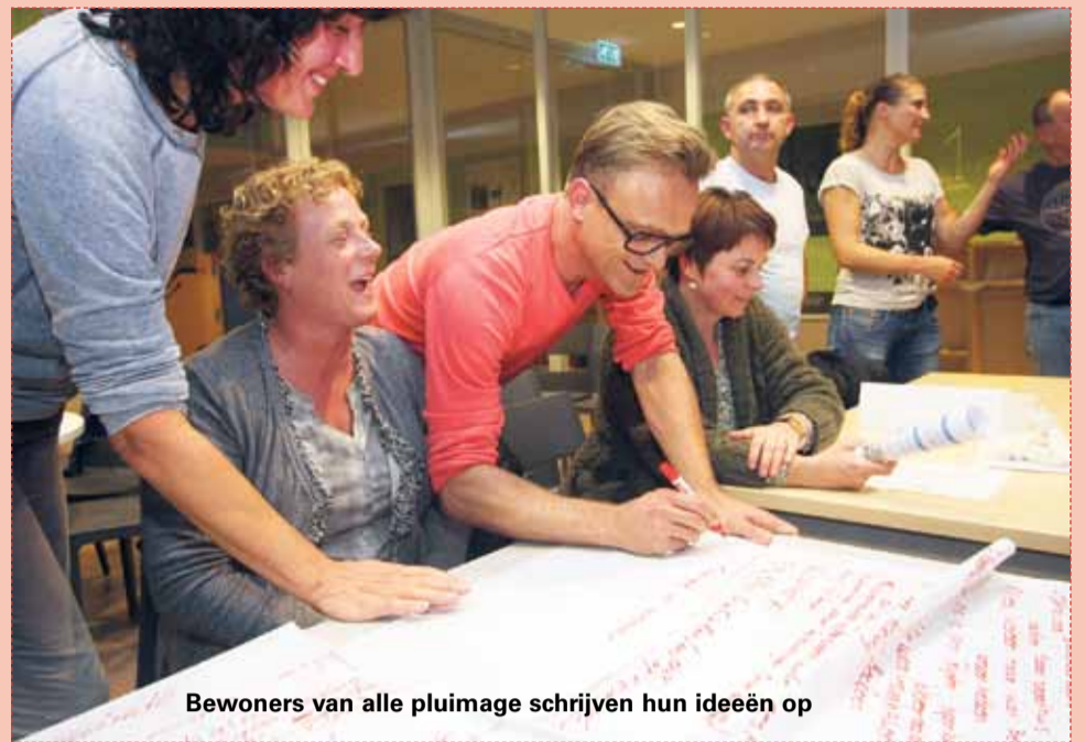
Bewoners van alle pluimage schrijven hun ideeën op

Meer oog voor ouderen maar ook jeugd, en elkaar. Bewoners zien graag dat initiatieven meer kans, ruimte en ondersteuning krijgen