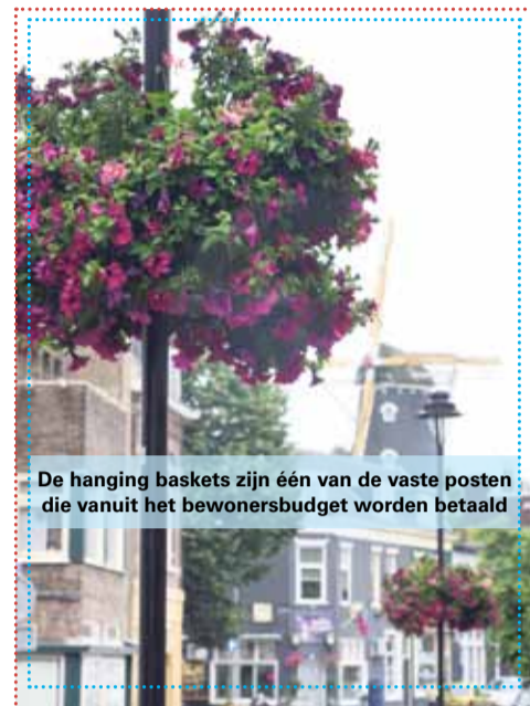
De hanging baskets zijn één van de vaste posten die vanuit het bewonersbudget worden betaald

Meer informatie en details over het wijkbudget kunt u opvragen bij opbouwwerker Rob Klingen: r.klingen@rijnstad.nl