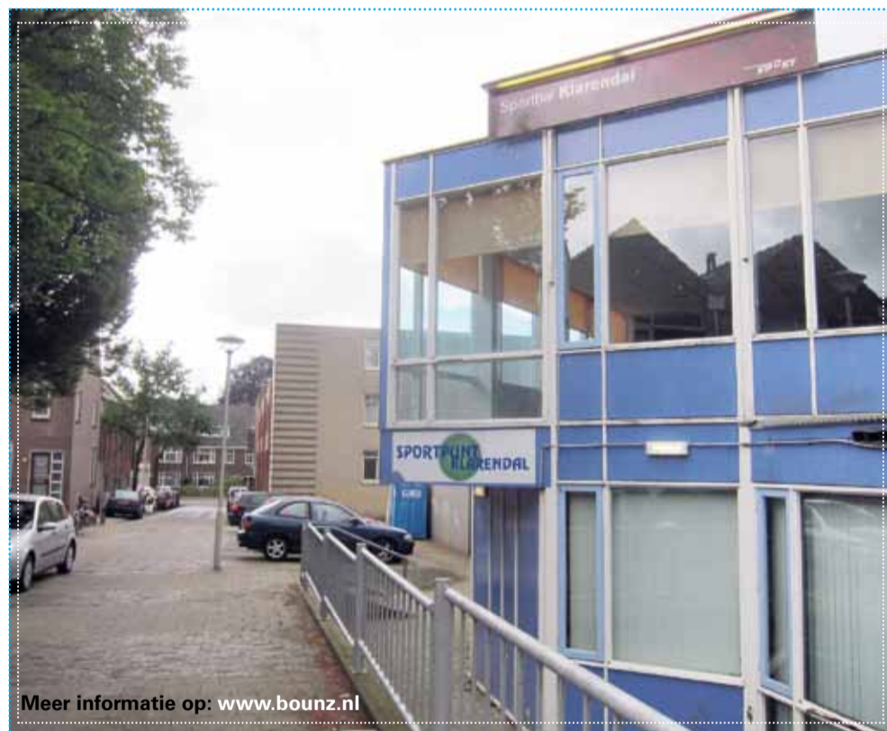
Meer informatie op: www.bounz.nl

Tijdens het laatste bewonersoverleg van juni kwamen de organisatoren over Bounz vertellen. Hun ambities voor Klarendal werden positief ontvangen.