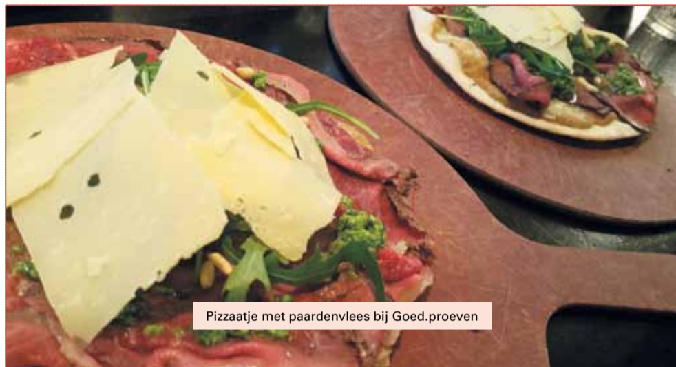
Pizzaatje met paardenvlees bij Goed.proeven

WIJ GAAN VOOR PAARD OP DE KAART! U TOCH OOK? WWW.FACEBOOK.COM/REDPAARDENSLAGERIJERNSTE