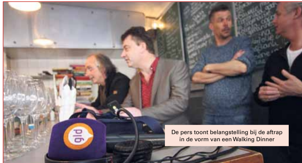
De pers toont belangstelling bij de aftrap in de vorm van een Walking Dinner

Eenmaal aangekomen bij Paardenslagerij Ernste krijgen we, ditmaal terwijl we een smakelijk stukje paardengehaktbal weghebben, een kijkje in de gehele slagerij. Paarden worden hier overigens niet meer geslacht, maar het vlees wordt er wel nog