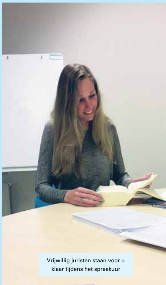
Vrijwillig juristen staan voor u klaar tijdens het spreekuur