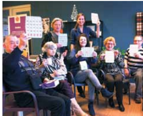
Enthousiaste Bingo-club zoekt spelers! Wie doet ook mee? Kom op vrijdag de 13e naar het MFC!

BINGO: Gezelligheid en de mogelijkheid om leuke prijzen te winnen! Wilt u, onder het genot van een kopje koffie of thee, aan de bingo meedoen? Kom dan vrijdag 13 februari om 15:00 naar MFC Klarendal, Kazerneplein 2. Vrije inloop, bingoplankje voor €2.