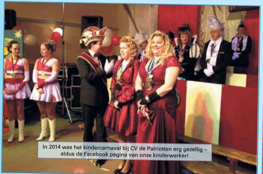
In 2014 was het kindercarnaval bij CV de Patriotten erg gezellig - aldus de Facebook pagina van onze kinderwerker!

Voor alle kinderen van 0-12 jaar , van 13.11 uur tot ongeveer 15.30 uur . In de zaal aan de Agnietenstraat 88 .