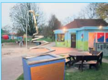
De werkelijke trofee is al een jaar op tournee door de wijk. Momenteel staat hij in het beheerdershuisje van de Leuke Linde

DEZE TROFEE GING GEPAARD MET EEN GELDBEDRAG VAN €50.000,00. "We hebben het samen gedaan, dus delen we de prijs" aldus Volkshuisvesting destijds, en het bedrag werd in vijf parten gedeeld. Een vijfde deel ging naar het BEWONERS-OVERLEG (voormalig Wijkplatform) en een ander vijfde deel ging naar ondernemersvereniging DOCKS . Deze beide partijen hebben het bedrag nog even op de plank gelegd. Er is geen haast om het geld op te maken en zij zijn er nog niet