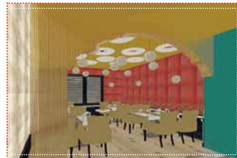
Artist Impression door Kaja horeca interieur van het toekomst

"De planning is dat we eind januari, begin februari 2015 de deuren openen"