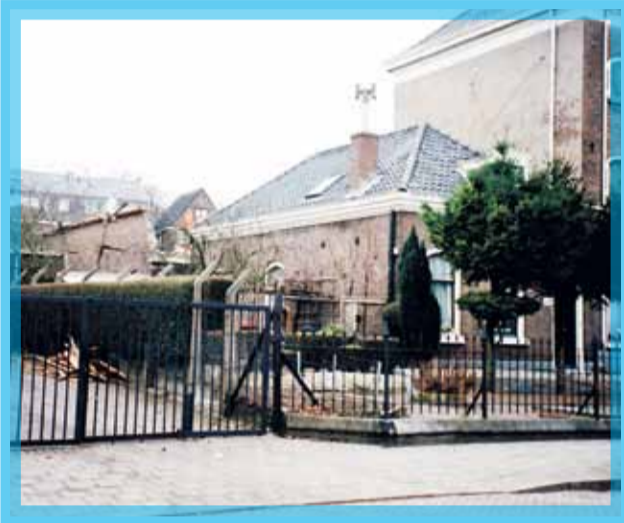
De militaire bakkerij vlak voor de sloop