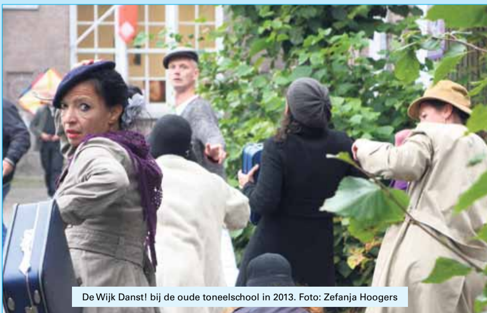
De Wijk Danst! bij de oude toneelschool in 2013.

Kijk op WWW.WIJKENVOORKUNST.NL en veel leuker: de FACEBOOKPAGINA - met voor degenen die deze krant ná het weekend van 20 en 21 september ontvangen vást een terugblik in beelden!