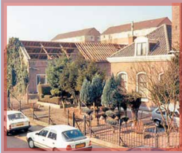
Het militaire terrein aan de Klarendalseweg waar de sloop begint, 1995