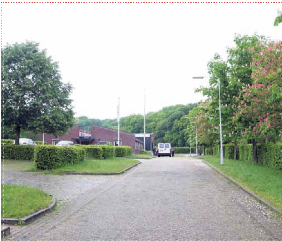
De voormalige gemeentewerf is momenteel in gebruik door 2SWITCH

www.arnhem.nl/Wonen_en_leven/Projecten/Gemeentewerf_Bosweg , is reageren zeker mogelijk. Download daar dus het formulier en GEEF UW REACTIE . De deadline daarvoor is na de informatieavond verschoven naar 15 JULI! Sturen naar gemeentewerfbosweg@arnhem.nl met goede argumentatie. De projectgroep neemt die mee naar een advies rapport voor het college.