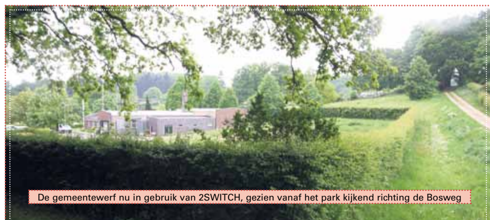
De gemeentewerf nu in gebruik van 2SWITCH, gezien vanaf het park kijkend richting de Bosweg

Voor contact met de Schouwgroep kunt u mailen naar: schouwgroepklarenbeek@gmail.com