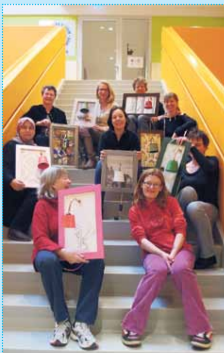
De dames met hun klusresultaten in het MFC

Het gaat heel goed met de KLUSCURSUS VOOR VROUWEN . Er is inmiddels een Vrouwenklusteam dat de cursussen organiseert, en in Arnhem Zuid bieden we onze cursus ook al aan! In januari/februari hebben een negen vrouwen uit Sint Marten, Sonsbeekkwartier, Klarendal en Geitenkamp enthousiast mee gedaan aan de basiscursus Niet klussen in je hoofd maar in je huis . Dit is de tweede basiscursus die wordt gegeven vanuit Klussendienst Klarendal e.o. in deze drie wijken.