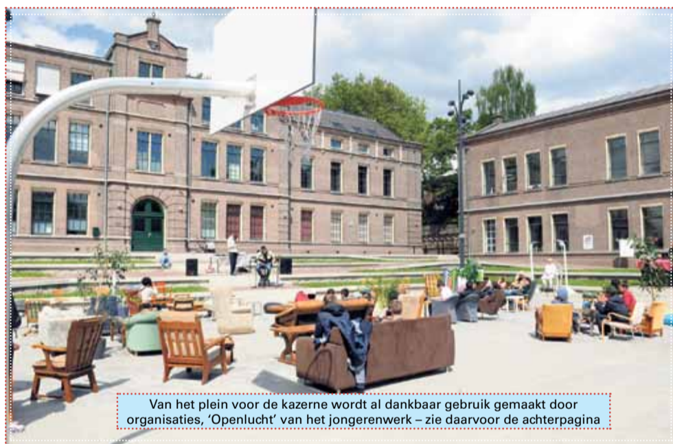
Van het plein voor de kazerne wordt al dankbaar gebruik gemaakt door organisaties, 'Openlucht' van het jongerenwerk – zie daarvoor de achterpagina

Het blijft hoe dan ook een centrum voor amateurkunsten. Ik zie de zon wel schijnen achter de donkere wolken!"